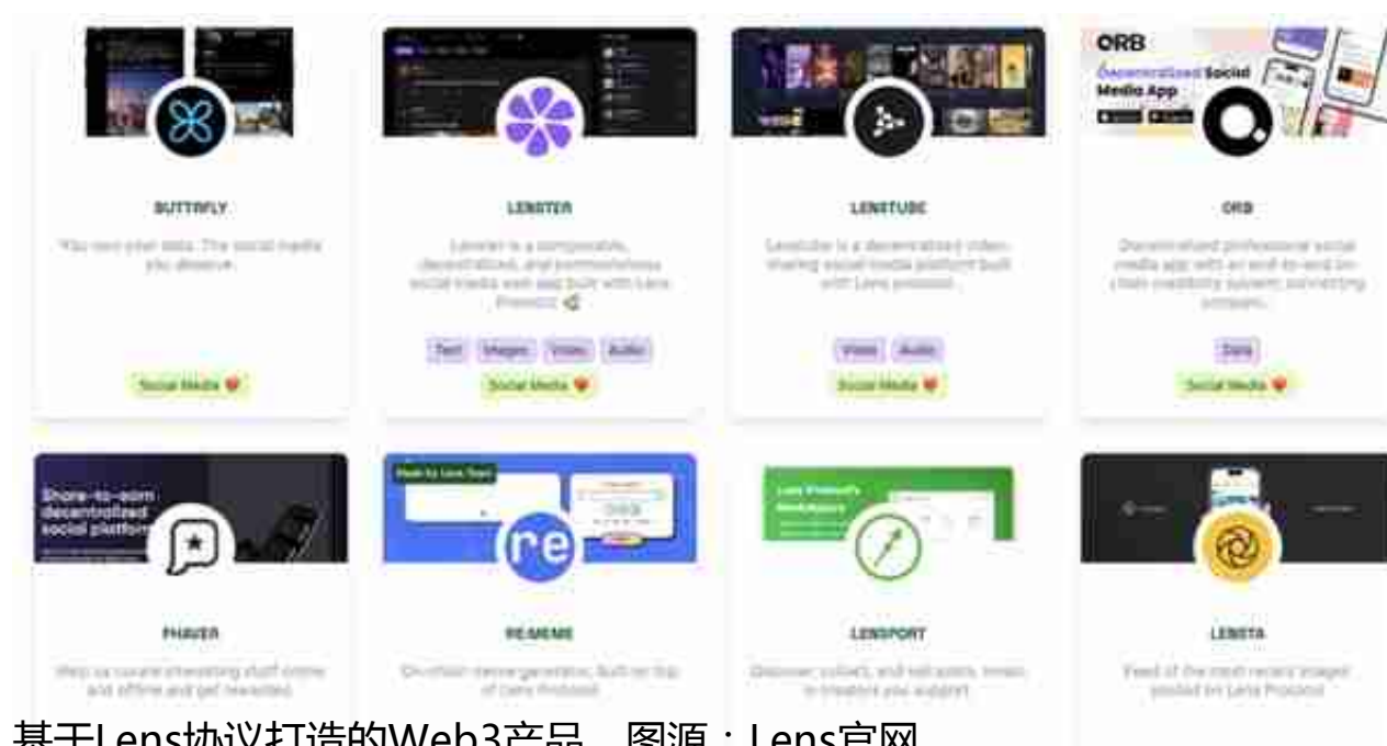
基于Lens协议打造的Web3产品。

另一个去中心化社交平台Mastodon则诞生得更早，于2016年推出，是一个自由开源的去中心化的微博客社交网络。它的功能和操作方式和Twitter相似，但整个网络以多个由不同运营者独立运作的服务器以联邦方式交换资料而组成，继而实现“去中心化”，被形容为“去中心化的Twitter替代品”。