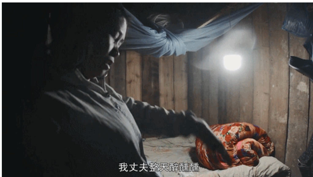
我丈夫整天醉醺醺