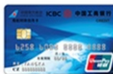
南航明珠牡丹信用卡