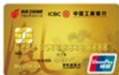
国航知音牡丹信用卡