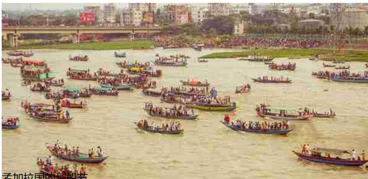
孟加拉国的划船节

孟加拉国的货币叫做“塔卡”，最高面值1000塔卡约合70元人民币。1000塔卡正面人物均为第一任孟加拉国总统谢赫·穆吉布·拉赫曼（1920-1975），背面是孟加拉的国会大厦。