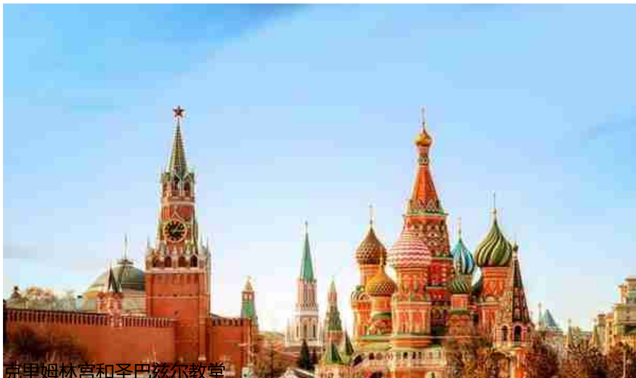
克里姆林宫和圣巴兹尔教堂