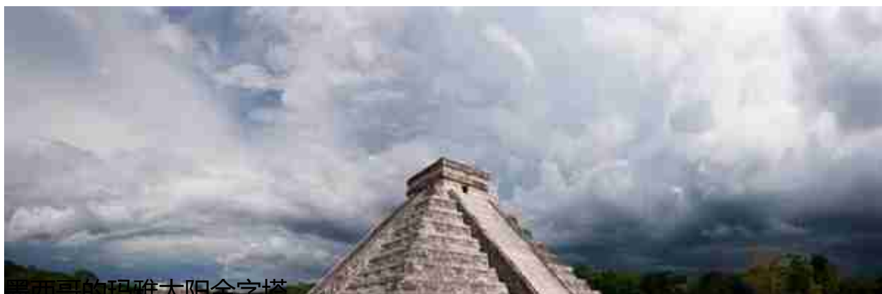
墨西哥的玛雅太阳金字塔