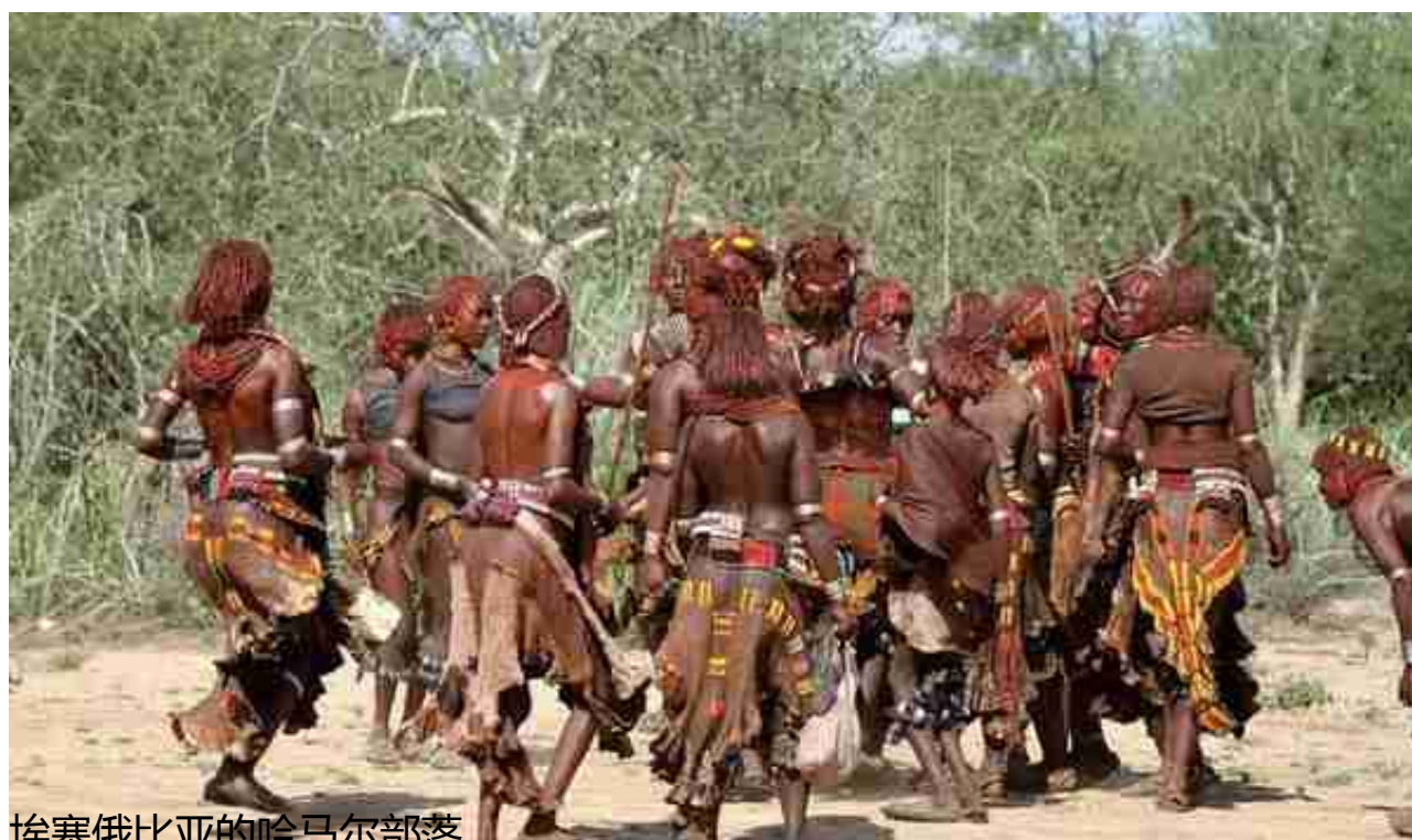
埃塞俄比亚的哈马尔部落

10000日元印着日本明治时期的思想家，教育家福泽谕吉。主张脱亚入欧论，他也是日本侵略亚洲路线的基本设计者，堪称“日本近代第一位军国主义理论家”。