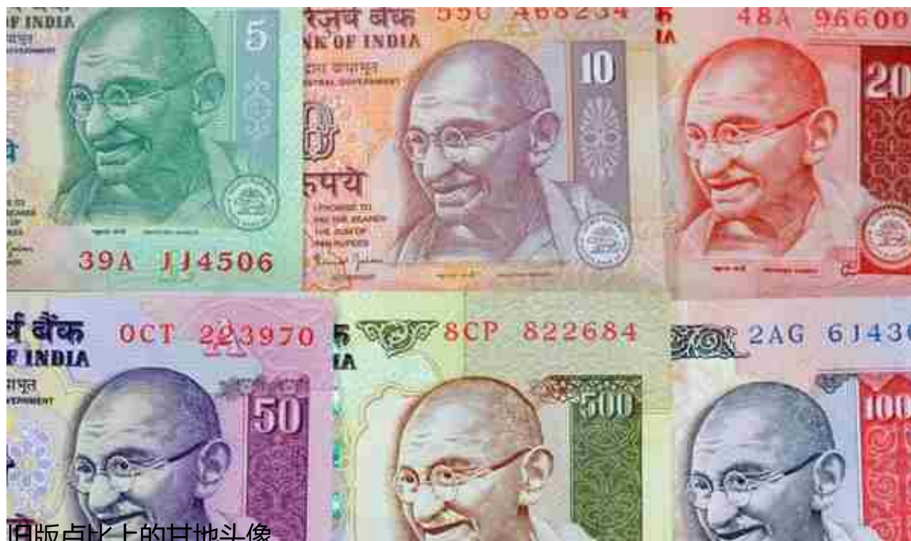
旧版卢比上的甘地头像