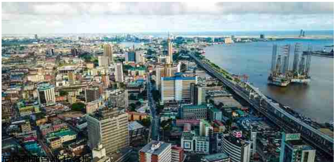
尼日利亚首都 拉各斯