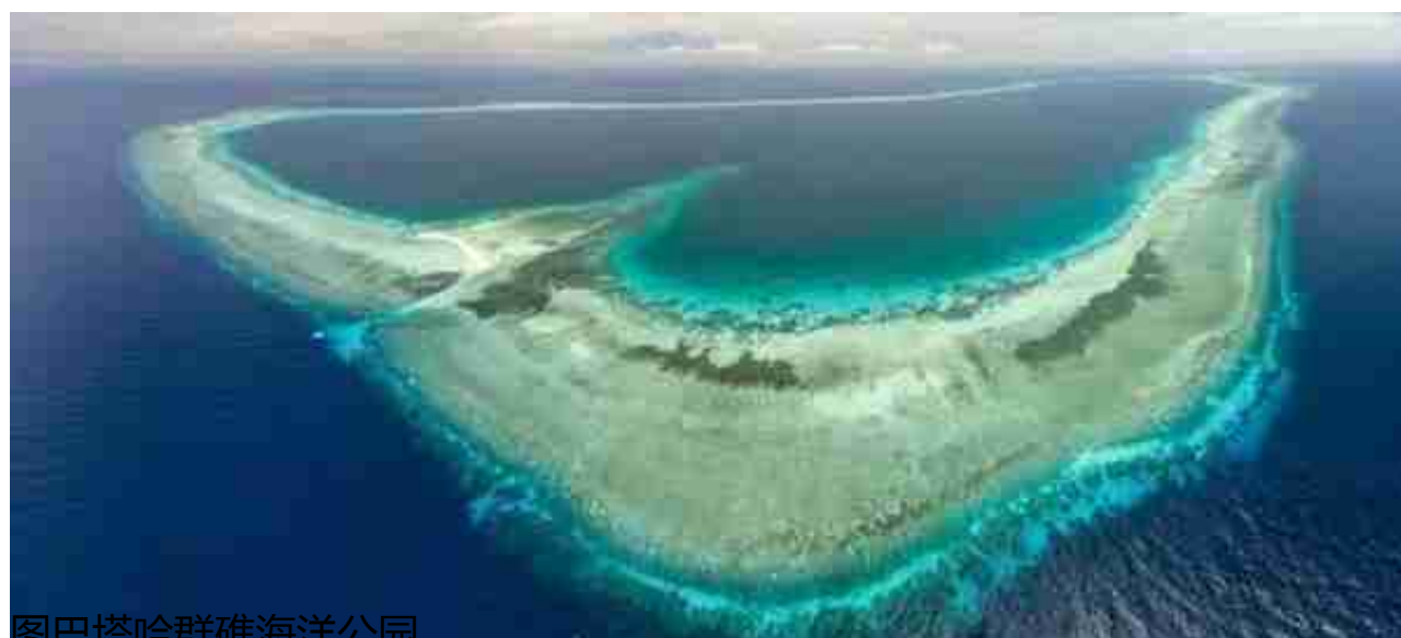
图巴塔哈群礁海洋公园