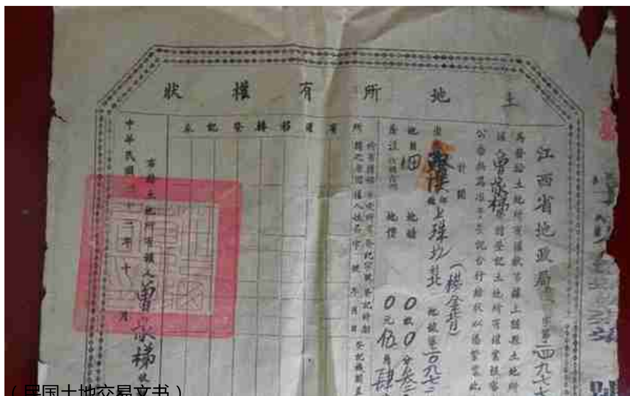
(民国土地交易文书)