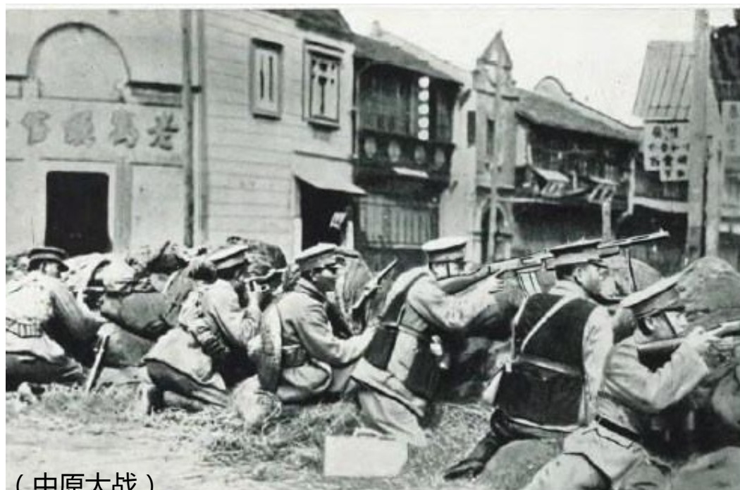
( 中原大战 )

1933年3月8日，民国政府颁布了《银本位币铸造条例》，规定所有货币以后都叫“元”了。同年四月，又实行“废两改元”政策。