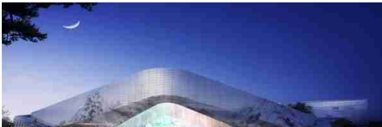
南湖广场文旅综合体

衢州儒学文化产业园设立于2011年10月，其核心区包括孔氏南宗家庙、孔子文化公园、北门街和水亭门两大历史文化街区等；延伸区为开化根宫佛国文化旅游区和常山石博园。