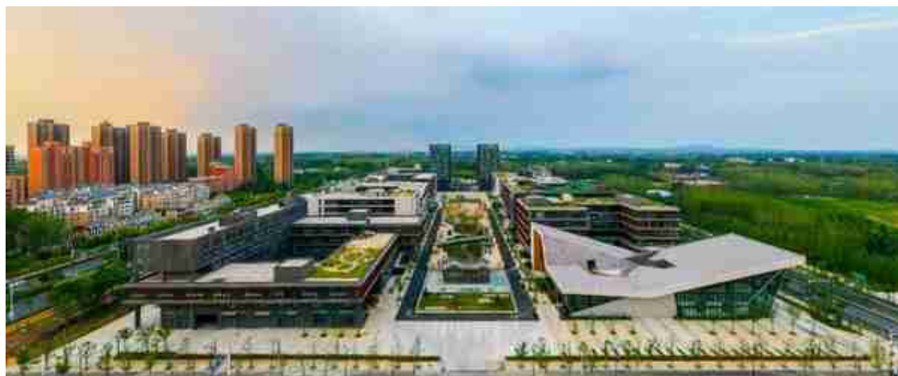
滨湖卓越城文华园

近年来，园区紧密围绕主导产业链，内培外引，大力引进和扶持一批龙头企业。其中，安徽新华发行集团进入全国文化企业30强，安徽演艺集团和安达创展公司入选国家文化产业示范基地，安徽大剧院、微博文物修复、同人文化、滨湖集团、御邦文化、迅达文化、包河文投等企业入选省级文化产业基地，国家广播影视科技创新实验基地和包河融创文旅城入选省级重点扶持文化产业基地。