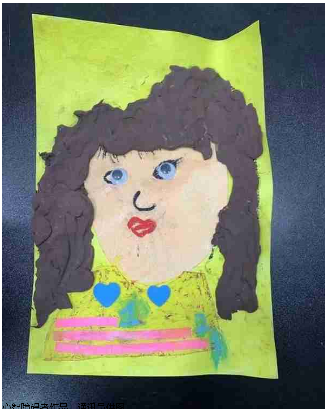
心智障碍者作品。