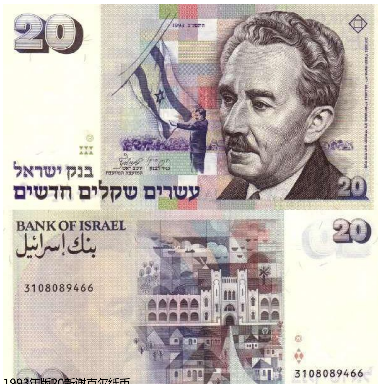
1993年版20新谢克尔纸币

第二套新谢克尔纸币是1999年开始发行的，共有20、50、100、200新谢克尔4种面额，也是以色列第七套银行纸币。