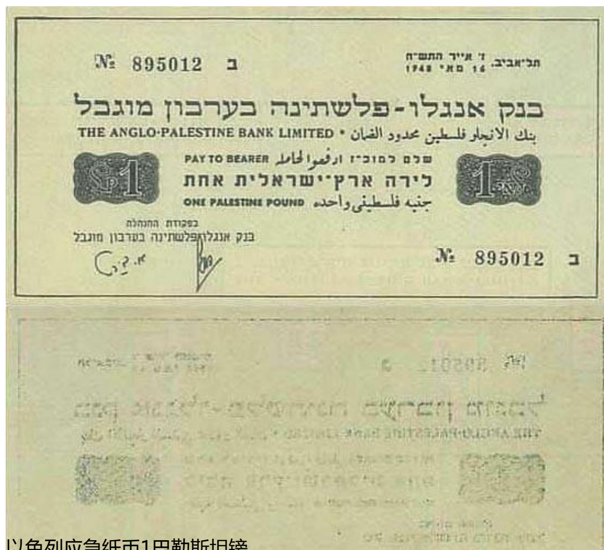
以色列应急纸币1巴勒斯坦镑

这批应急纸币还没正式发行，以色列委托美国印制的正式纸币就运到了，因此，应急纸币并没有实际发挥作用。