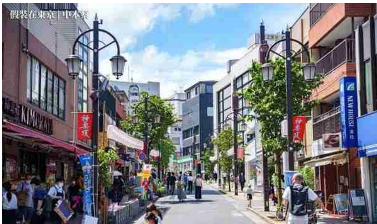
左边的KIMURAYA，在这买了好多瓶日威