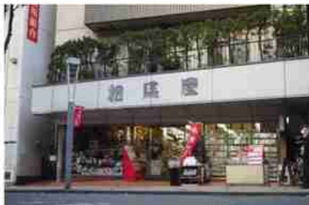
相馬屋是明治时代原稿用紙的发祥地

ウオレデリアの向かいにある「相馬屋洋品店」。「相馬屋さん」の製作者、地元で親しまれるこちらの文具具店は、明治時代は原稿用紙発祥の紙問屋として、文筆の暮らしに欠かせない場所でした。神楽坂駅からまっすぐ坂を降りて5分。歩いてみるまでたくさんのディスプレイが見えたら到着です。入り口付近には可愛らしい郵便箱が並ぶ。信ち着いた区内では文具具の話題はもちろん、ちょっとしたおもちゃも揃っています。