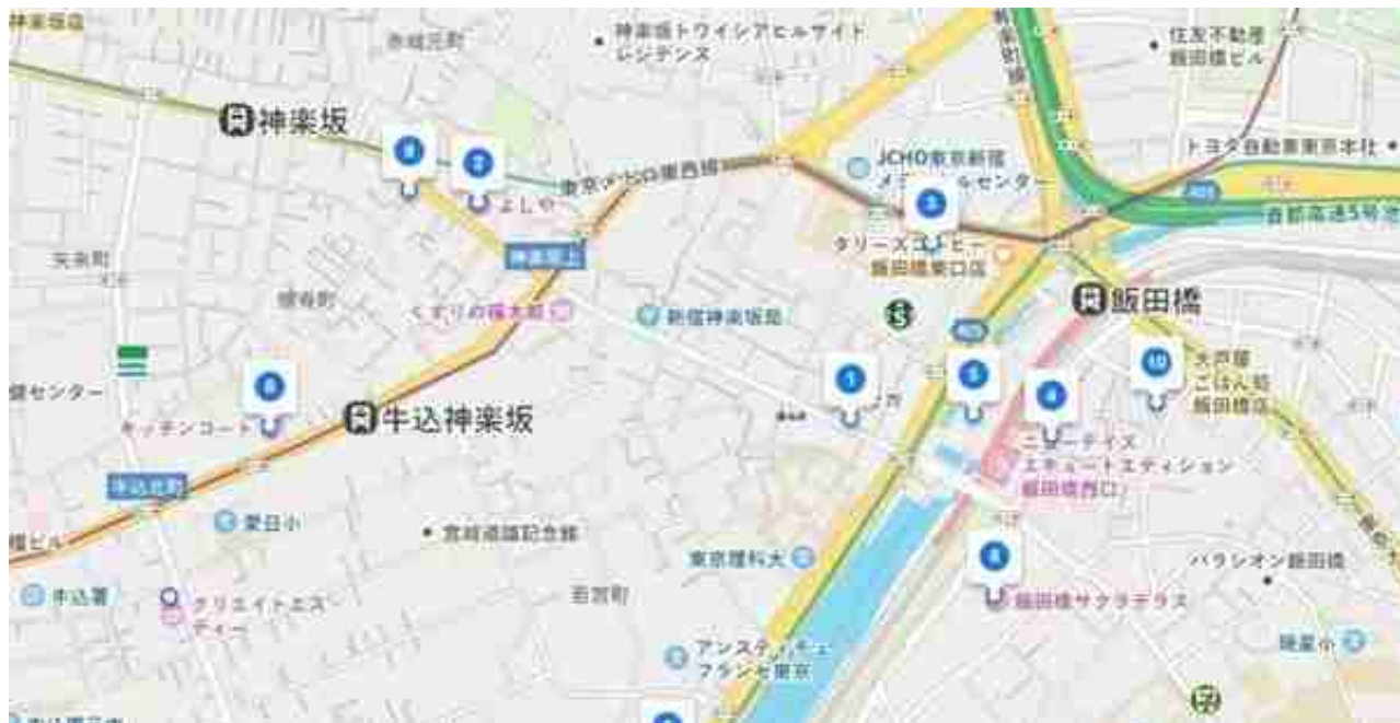
十个超市的位置分布