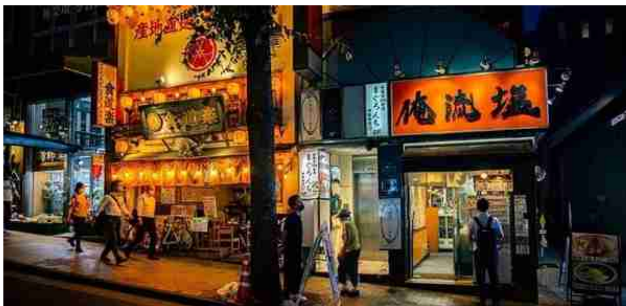
夜晚的居酒屋和拉面馆。