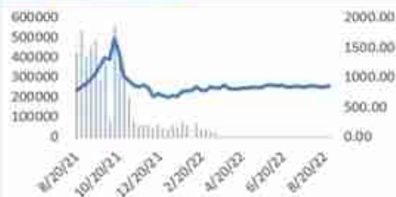
图 23: DCE 动力煤走势图