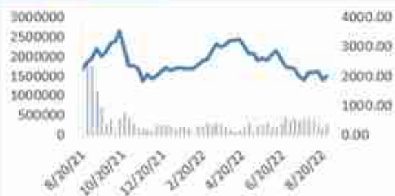
图 22: DCE 焦煤走势图