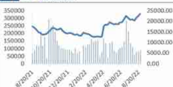
图 25: DCE 生猪走势图