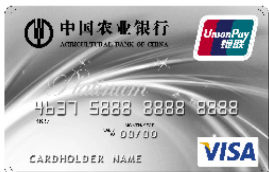
尊然白金信用卡(精粹版)

这是一款主打亲子概念的信用卡，不仅是女性朋友可以办理，男性也可以申办。目前有银联金卡、白金卡(银联白+Visa商务白)、家庭版(银联金卡)，建议探员们优先申请银联白金+Visa白金的套卡，这样就可以把银联和Visa的白金权益也都收入手中。如果申不下来，再退而求其次申请银联金卡；金卡的优点在于门槛低，作为农行的入门卡是非常不错的。首年免年费，刷卡满5次免次年年费。农行漂亮升级妈妈信用卡还有小白金卡之称，且具有积分不清零的特点，1元1积分，换购商品多。该卡是居家旅行、购物消费的百搭型产品。