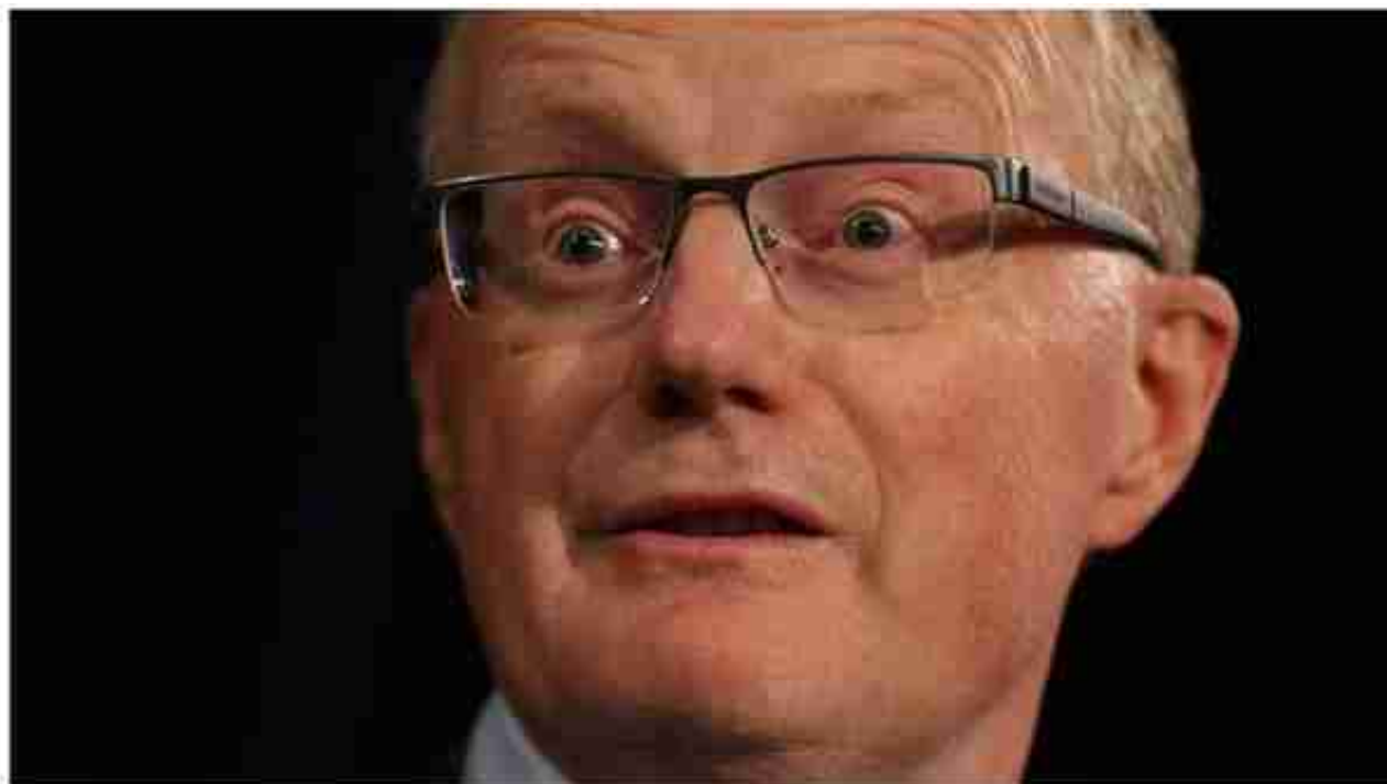
RBA governor Philip Lowe says July's rate rise may not be as brutal as many fear.