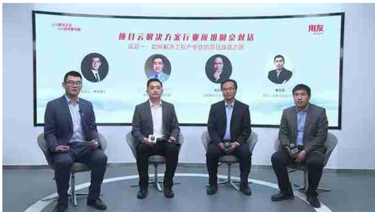
圆桌议题一：如何解决工程产业链的项目效益之困