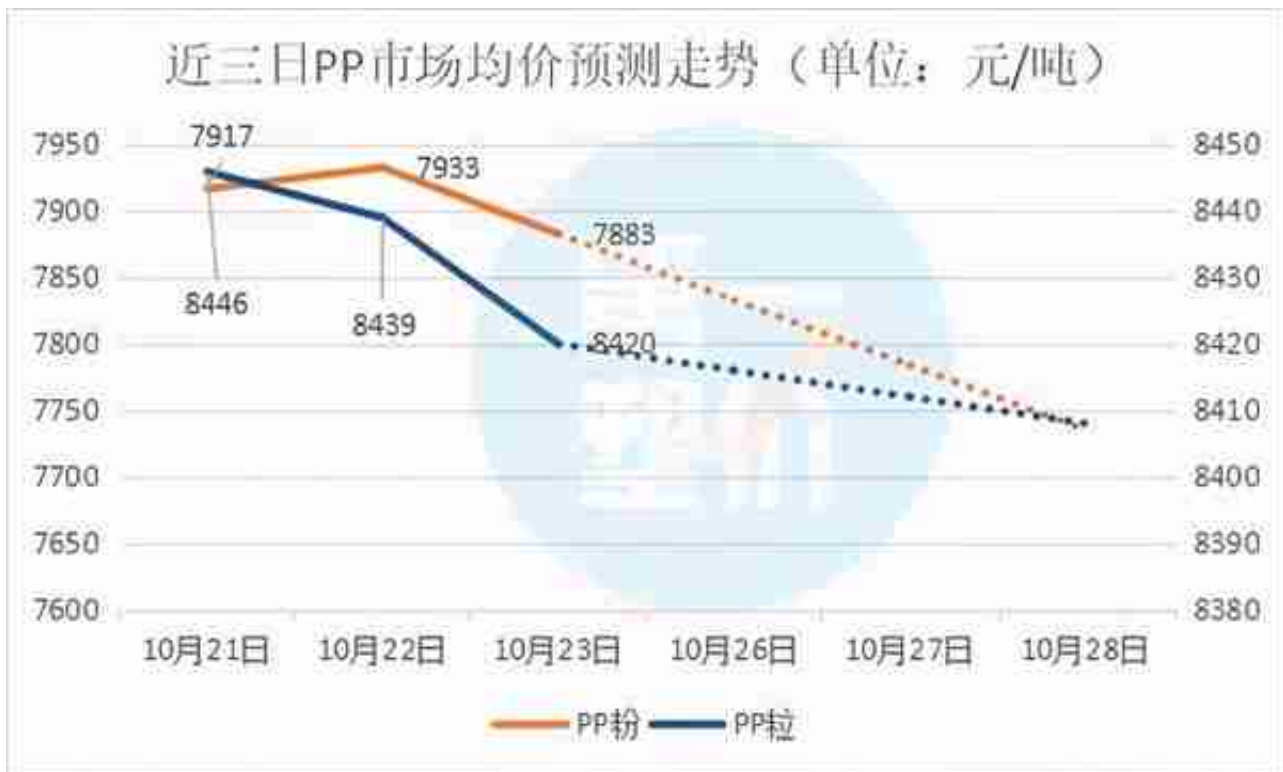
PP近三日价格预测走势

货夜盘震荡走低，现货报盘心态缺少支撑。上周五部分大区出厂价格下调，中间商报盘成本回落。下游工厂按需接货， 预计今日PP市场报盘弱勢整理。