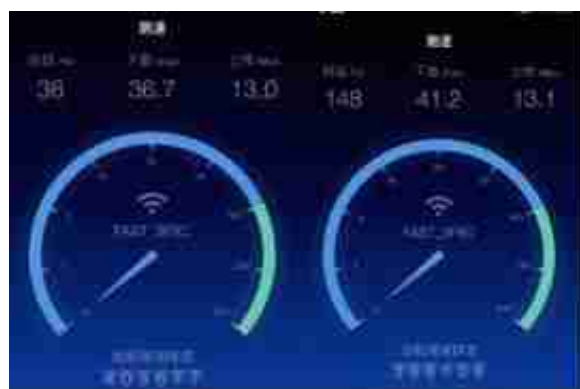
远距测 近距测 普通路由器

而使用多台设备连接拯救者路由器玩《王者荣耀》时，两台设备信号都是稳定状态，极少次出现信号黄色状态。之前使用家中的普通路由器在客厅玩游戏，时不时出现460红色延迟，相比之下拯救者路由器好得不是一点半点了。