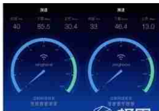
近距测 远距测 拯救者路由器