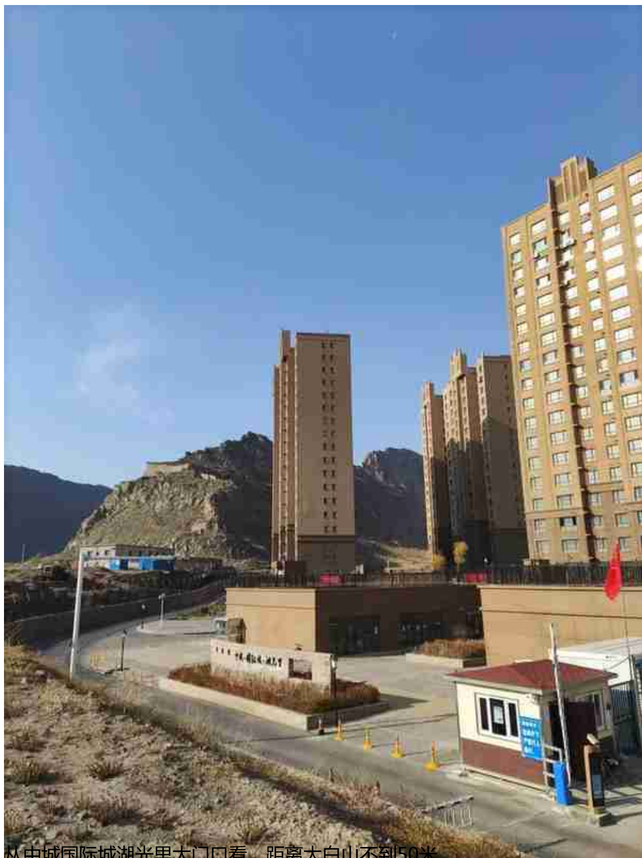
从中城国际城湖光里大门口看，距离大白山不到50米