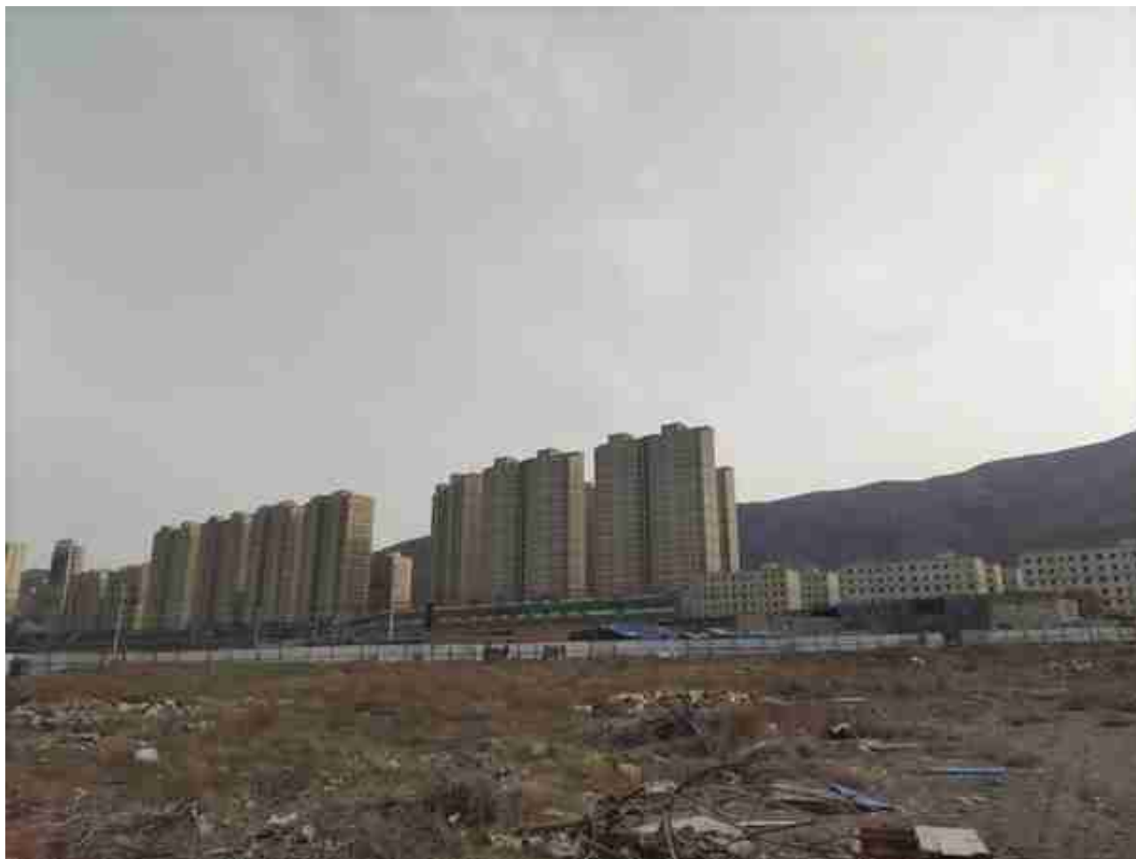
力鼎新城背后就是石火山