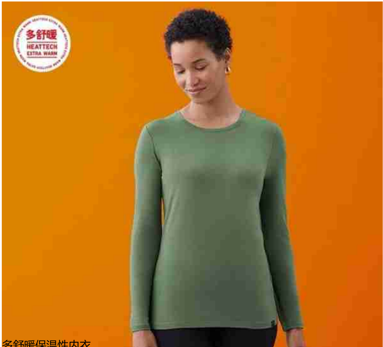
多舒暖保温性内衣