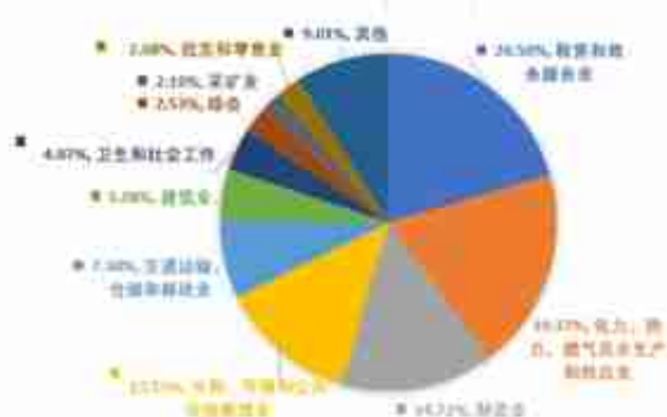
图 6: 2021 年交易所一般融资租赁行业分布情况 (单位: 亿元、单)