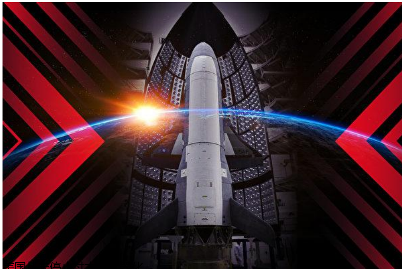
美国从未停止过太空武器化