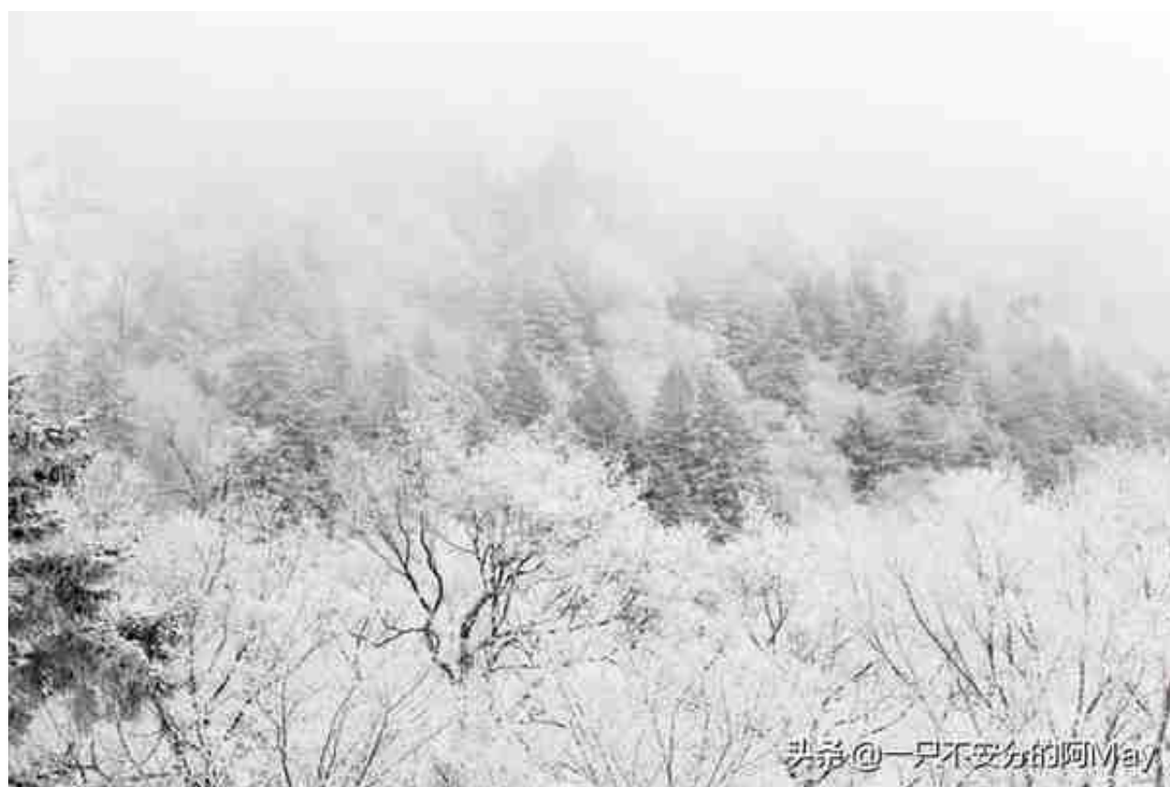
头条 @一只不安分的阿May