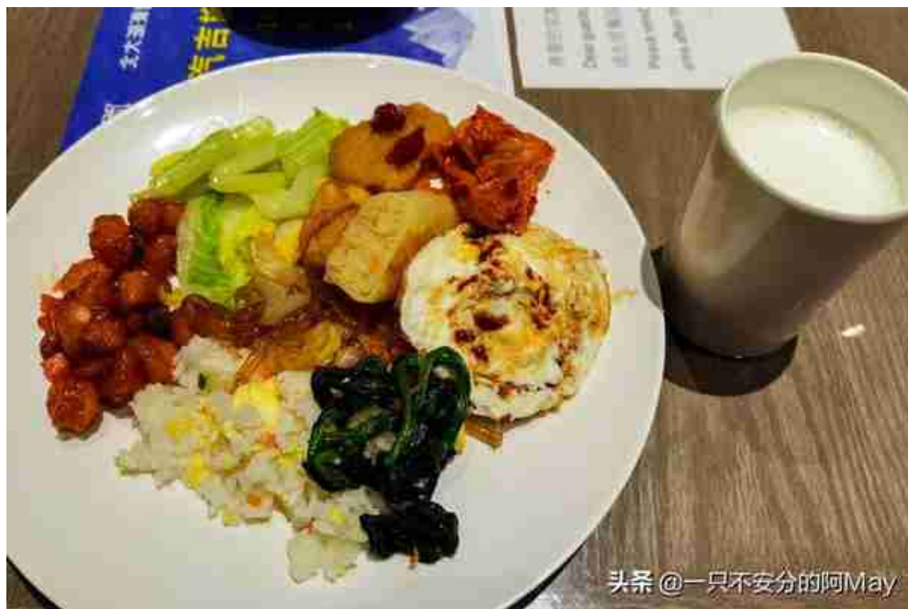
头条 @一只不安分的阿May

酒店的餐食还算丰富，豆浆、牛奶、咖啡、果汁，也有粥、米饭、各种蛋、蔬菜、水果，简直不能再营养了。少吃一点，出发！