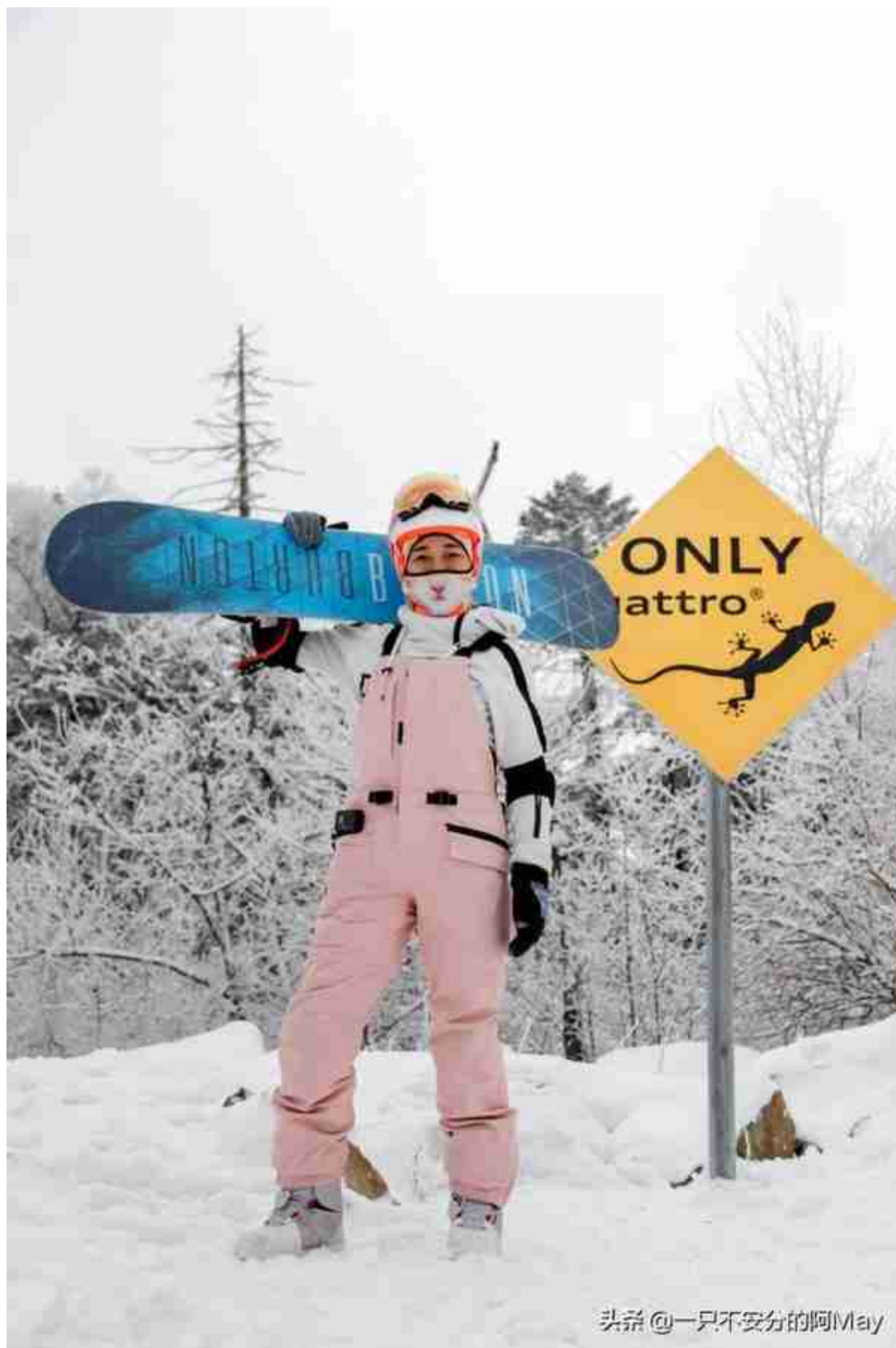
头条 @一只不安分的阿May