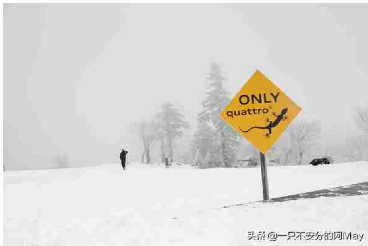
头条 @一只不安分的阿May