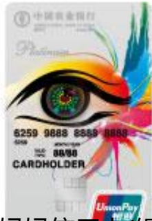
漂亮升级妈妈信用卡(银联白金)