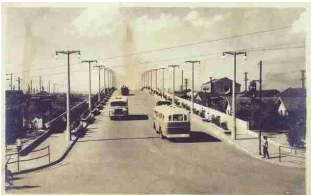
开通之初的共和新路旱桥因是上海东站配套工程，故称为上海东站旱桥↑