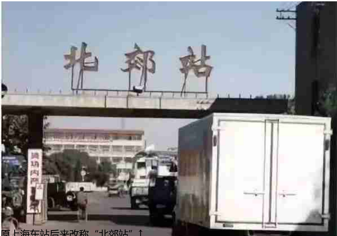
原上海东站后来改称“北郊站”↑