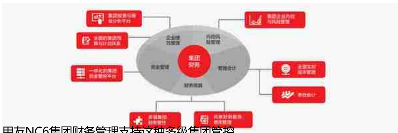
用友NC6集团财务管理支持这种多级集团管控

用友NC6，借鉴国际先进的财务管理模式，总结上万家大型企业的业务实践，采用新的互联网架构技术构建，与企业信息系统集成，实现全业务共享、全员应用、满足企业高可用、高并发的业务需求；能够实现与业务系统和财务系统基础数据共享，业务数据集成的应用，在财务共享服务模式下实现业务财务的无缝集成应用，满足大型企业私有云+公有云多种部署方案，为集团化企业提供财务管理咨询+信息化平台+实施服务的方案，帮助中国大型企业转型以“战略财务+业务财务（管理会计）+共享财务”为核心的财务2.0时代。