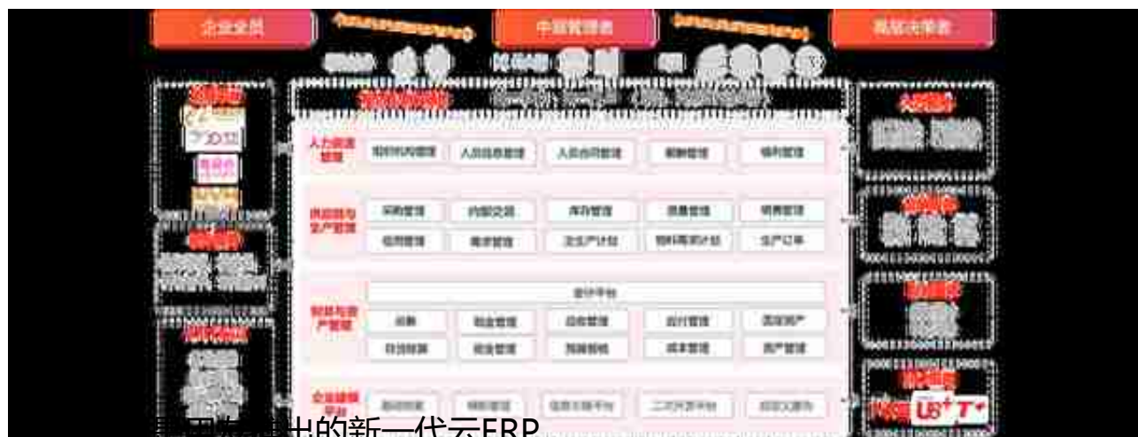
U8+ cloud是用友推出的新一代云ERP