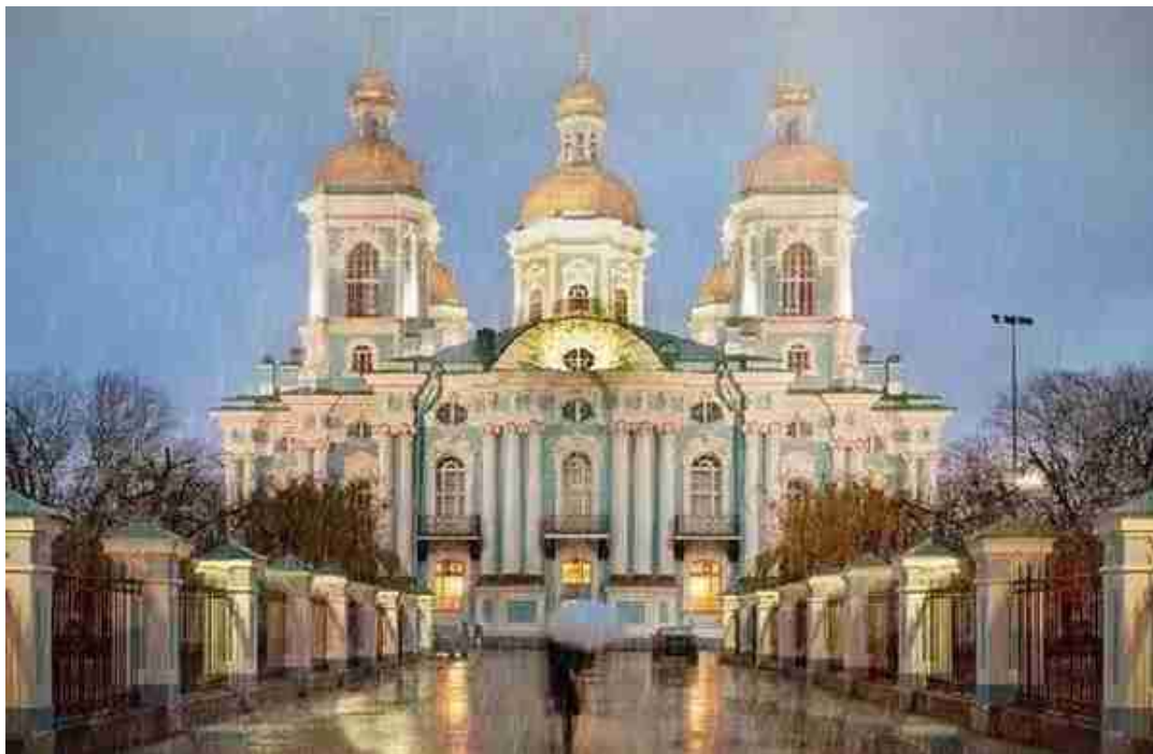
图 | 海军大教堂