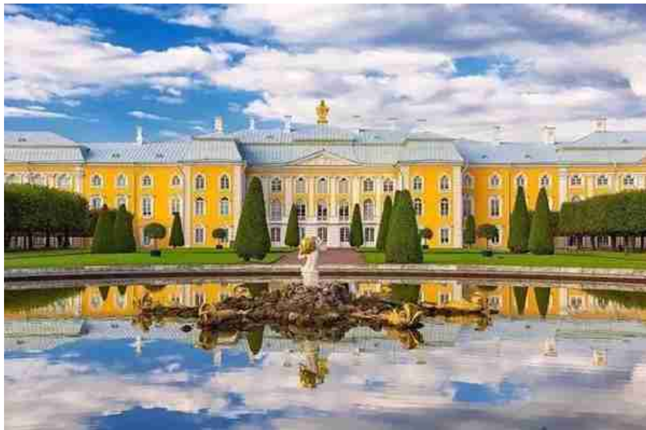
图 | 夏宫