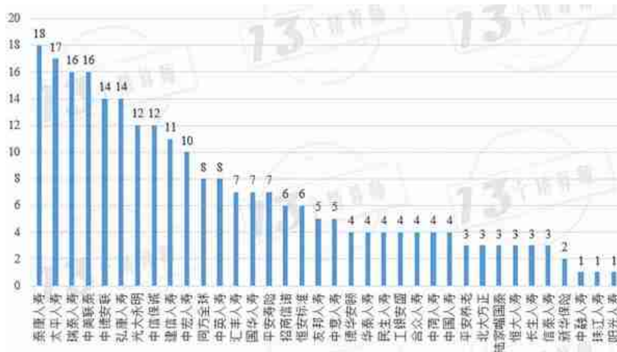
图1.2 36家寿险公司投连险产品数量（截止2022年6月30日）

2022年6月末，“13精”共收录投连险产品数量为250款，其中稳健型产品92款，平衡型产品63款，进取型产品95款。