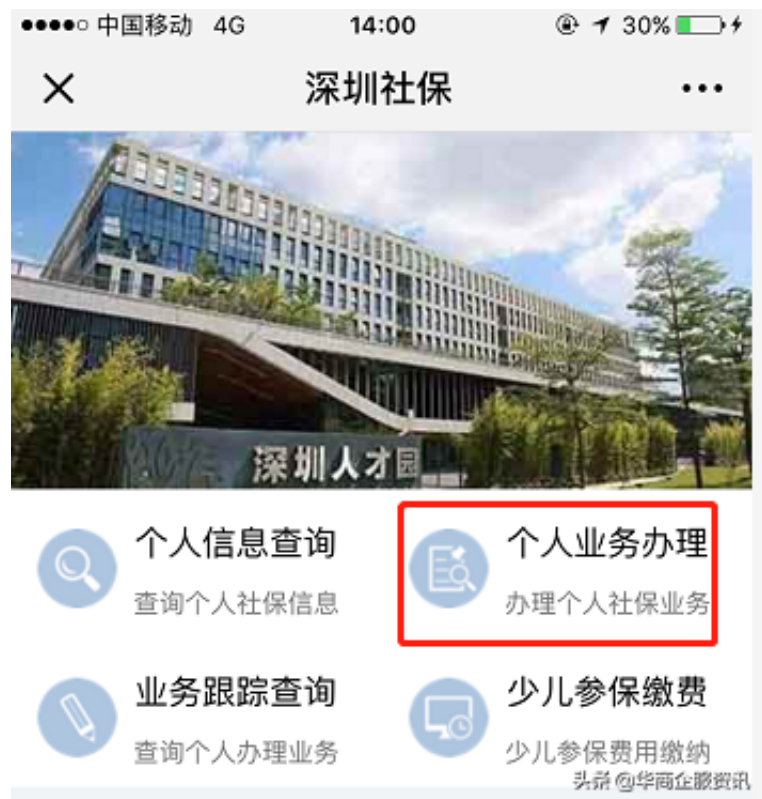
( 微信办理页面 )

社保对于个人而言，具有的重要性还是非常大的，因此有必要缴纳社保。而社保基本上是由公司代为上缴，不过也存在没有工作的人群。那么深圳社保个人怎么交，以及缴纳社保需要注意哪些问题，各位是否知道呢?现在我们一起来看看吧。