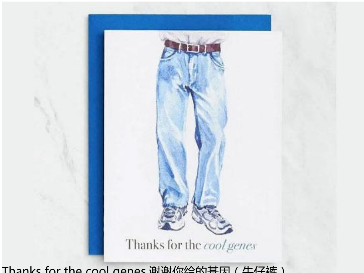
Thanks for the cool genes.谢谢你给的基因（牛仔裤）。