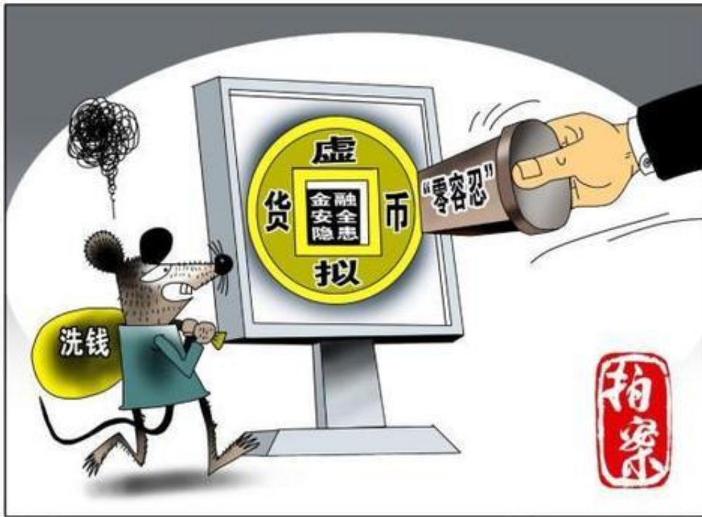
打击虚拟货币洗钱犯罪任重道远