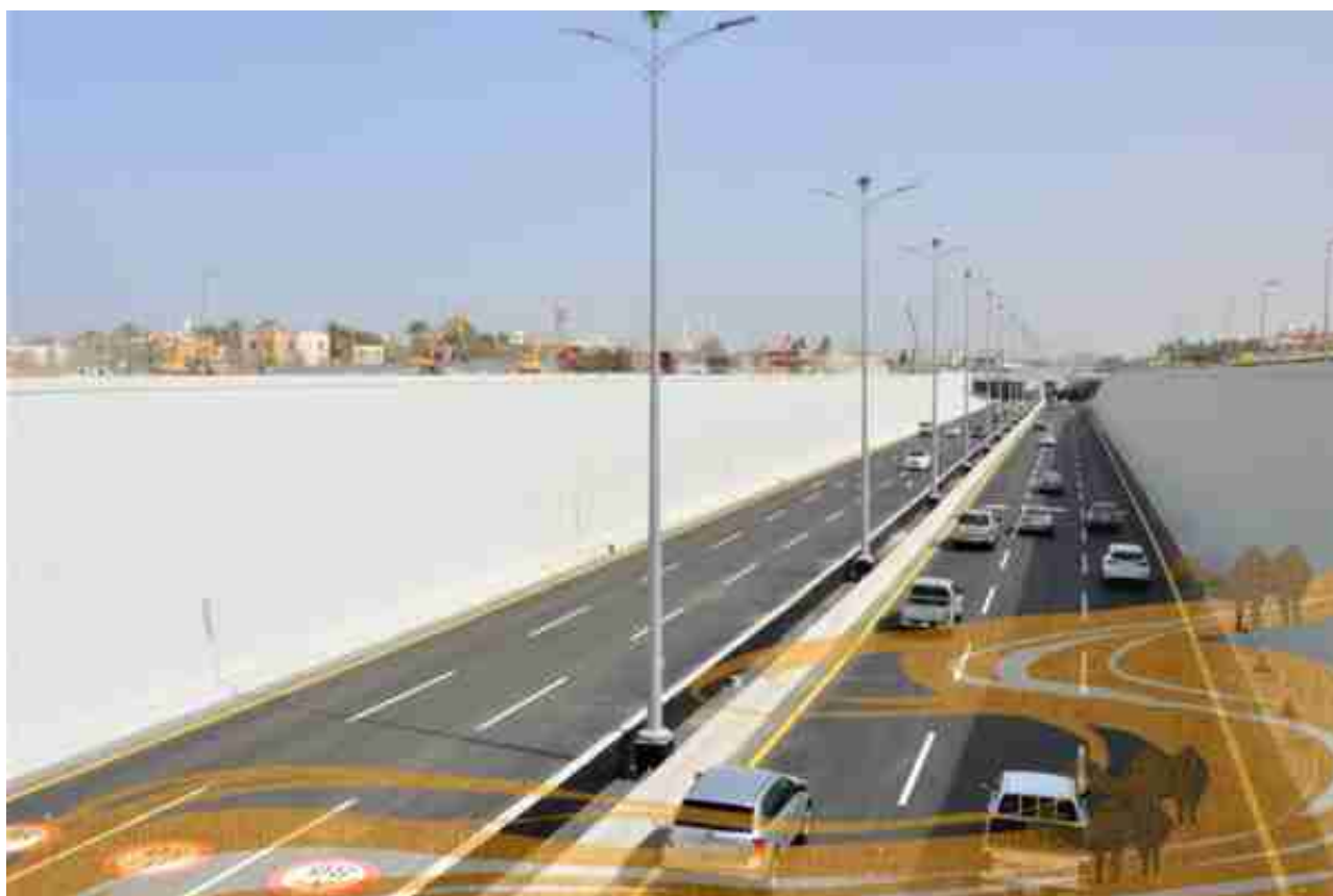
▲沙特吉达阿齐兹国王路地下道项目