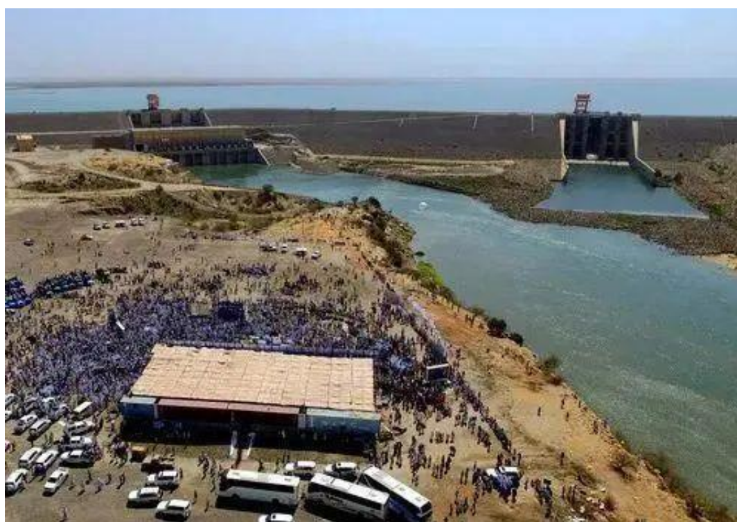
▲苏丹上阿特巴拉水利枢纽正式发电庆典现场