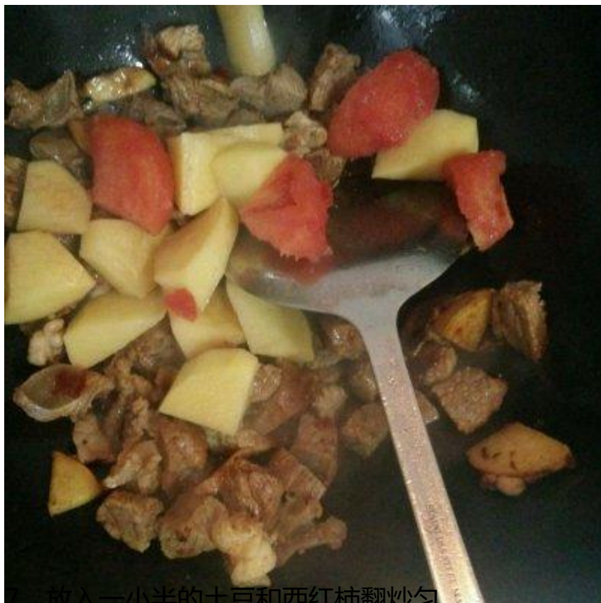
8、放入一小半的土豆和西红柿翻炒匀。