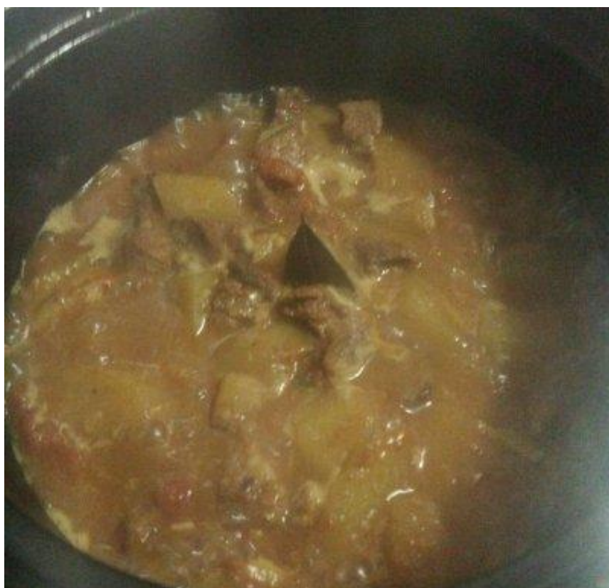
9、二十分钟后再放入剩下的土豆西红柿，半小后就可以开大火收汁出锅了。