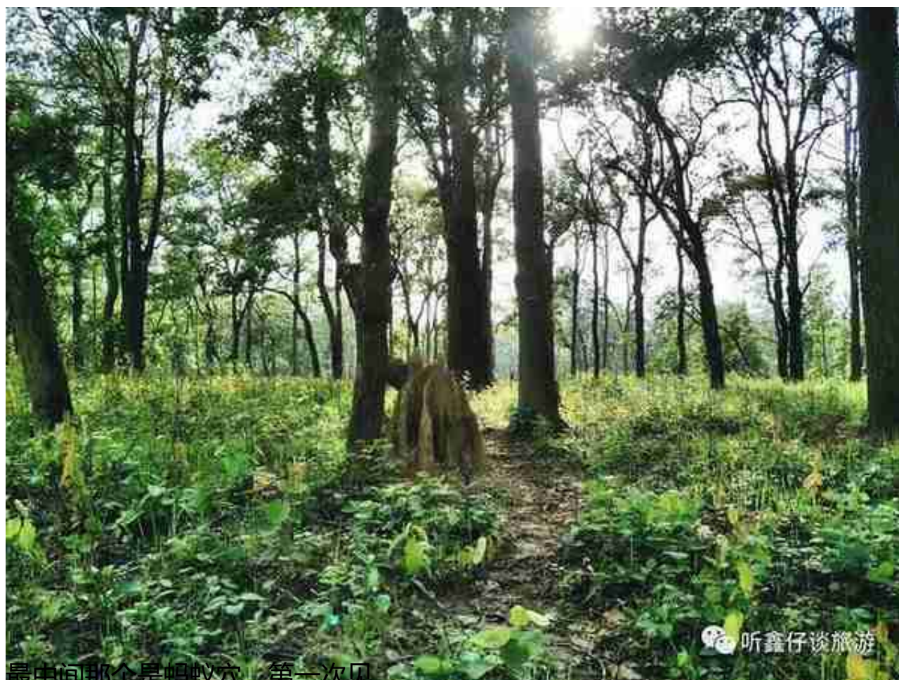
最中间那个是蚂蚁穴，第一次见。