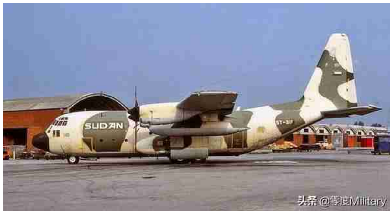
C-130H运输机 (共1架, 图中展示1架)