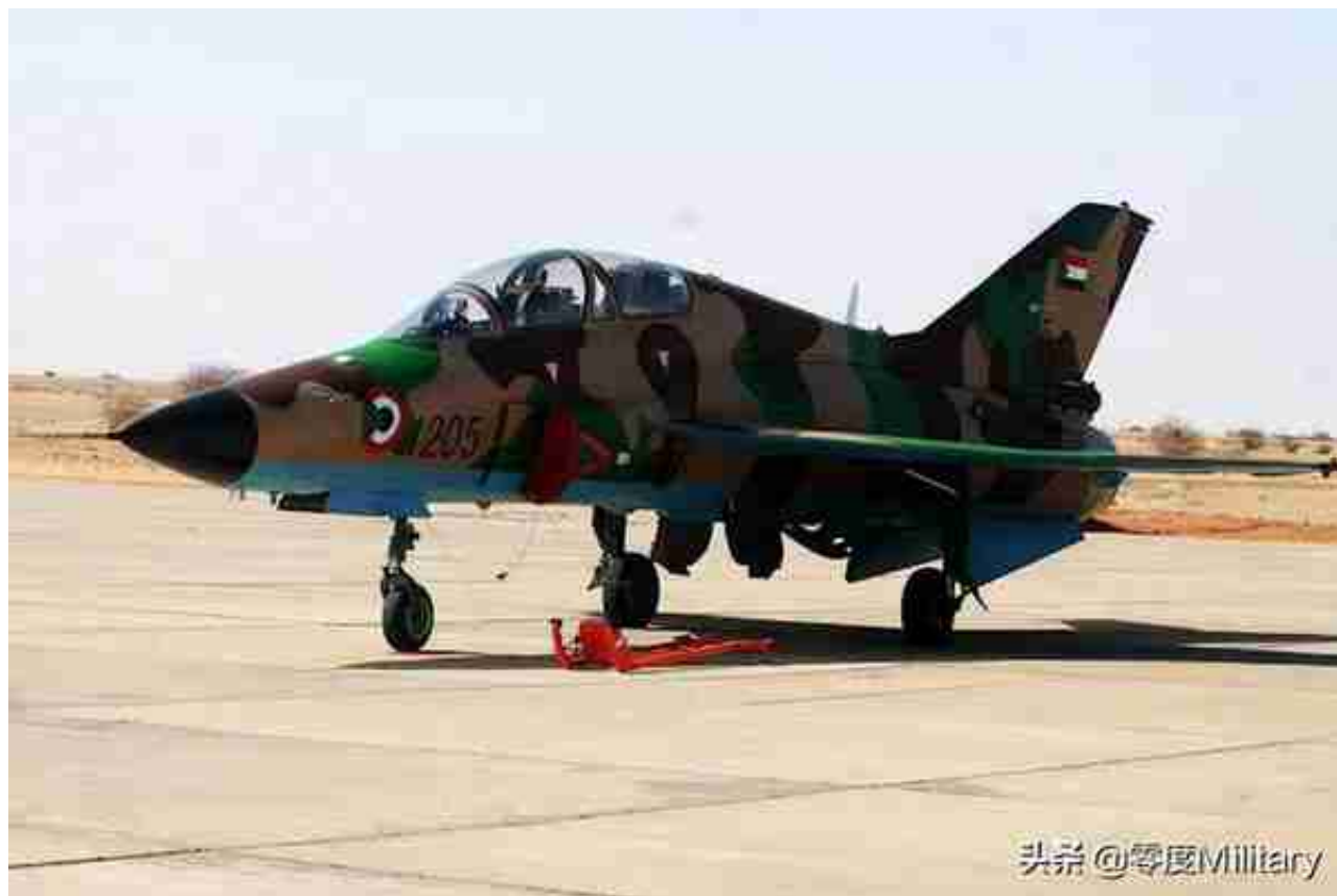
FTC-2000教练机（共6架，图中展示1架）