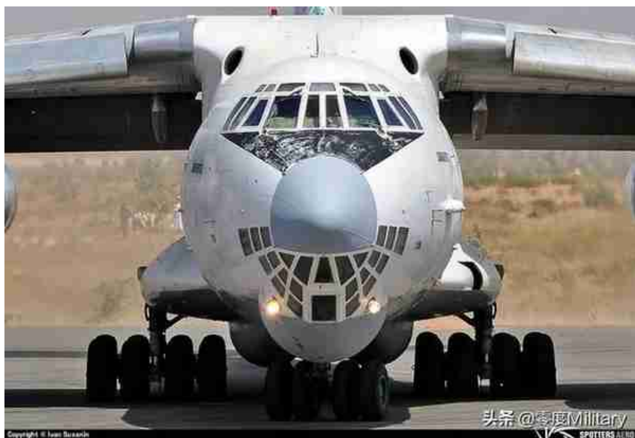
伊尔-76TD运输机 (共1架, 图中展示1架)