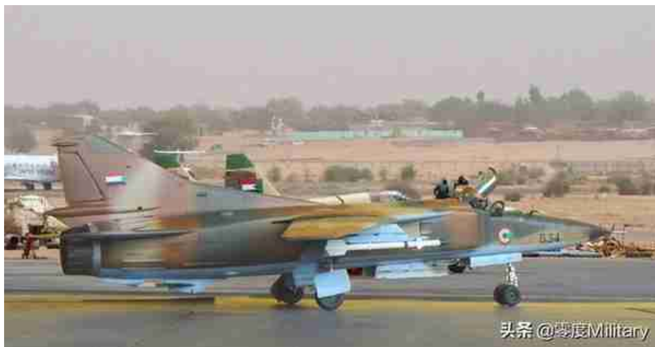
米格-23MS战斗机 (共3架, 图中展示1架)