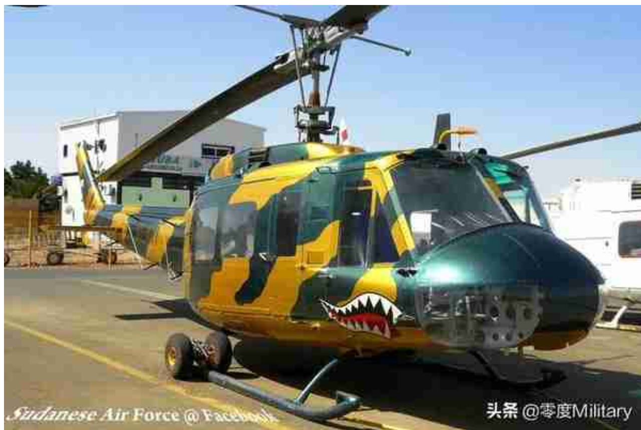
Bell 205通用直升机 (共2架, 图中展示1架)