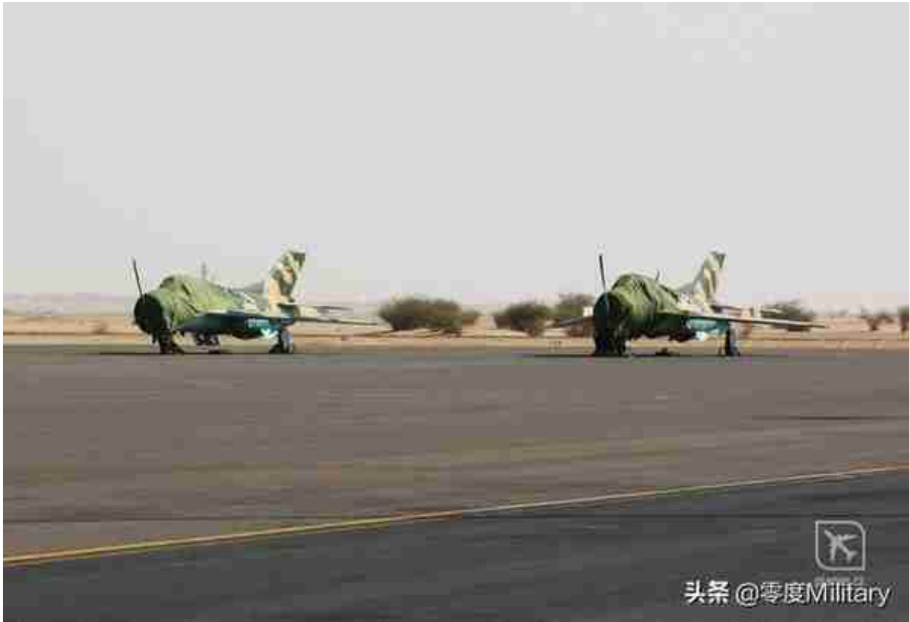
F-6战斗机 (共8架, 图中展示2架)