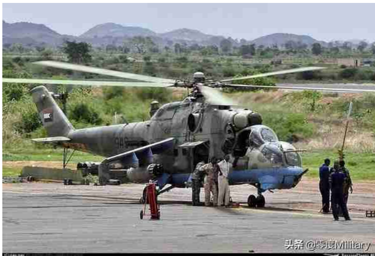
米-24V/24P/35武装直升机 (共43架，图中展示1架米-24V)