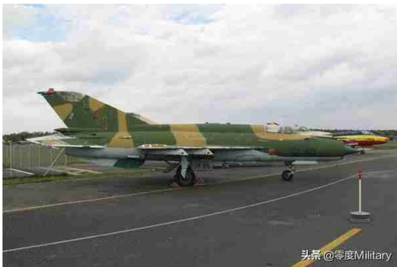
米格-21战斗机 (共4架, 图中展示1架)