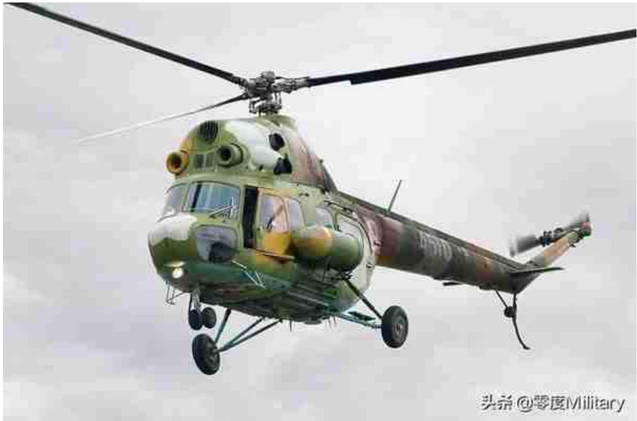
米-2轻型多用途直升机（共1架，图中展示1架）