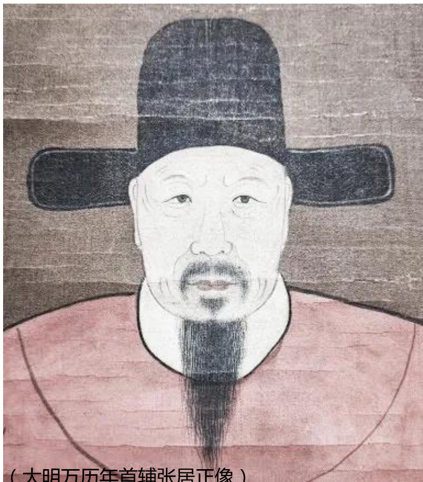
(大明万历年首辅张居正像)

张居正之所以如此招摇，不光是因为位高权重，也因骑马乘车太过辛苦，毕竟回江陵的“条件不允许”。而到了大清朝，康熙和乾隆两朝皇帝可就比较聪明的多了，他们爷孙分别六次南巡，大部分路程都是沿京杭大运河乘船往返，只是到了驻跸之处才换马骑行（天津的水西庄和柳墅行宫都是乾隆曾经的下榻之所）。据记载，乾隆每次南巡历时四五个月，随驾当差的军人3000名、马6000匹和船四五百条，还有3600名纤夫，六班倒的拉纤前行。