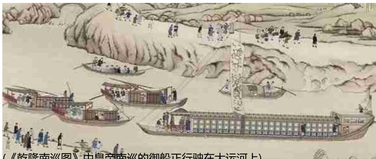
(《乾隆南巡图》中皇帝南巡的御船正行驶在大运河上)