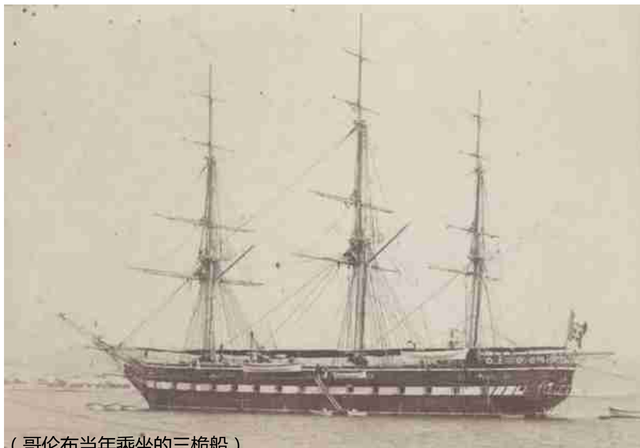
( 哥伦布当年乘坐的三桅船 )

第一批到达美洲的西班牙殖民者，疯狂抢掠着美洲大陆，从金银财宝到资源物产，用唾手可得的财富膨胀了西班牙帝国。他们给美洲带去了马、猪、羊和各种传染病，也把美洲的物产带到了旧大陆。西红柿、马铃薯、玉米、番薯、辣椒就是西班牙人带回到欧洲，并占据了全世界的餐桌。