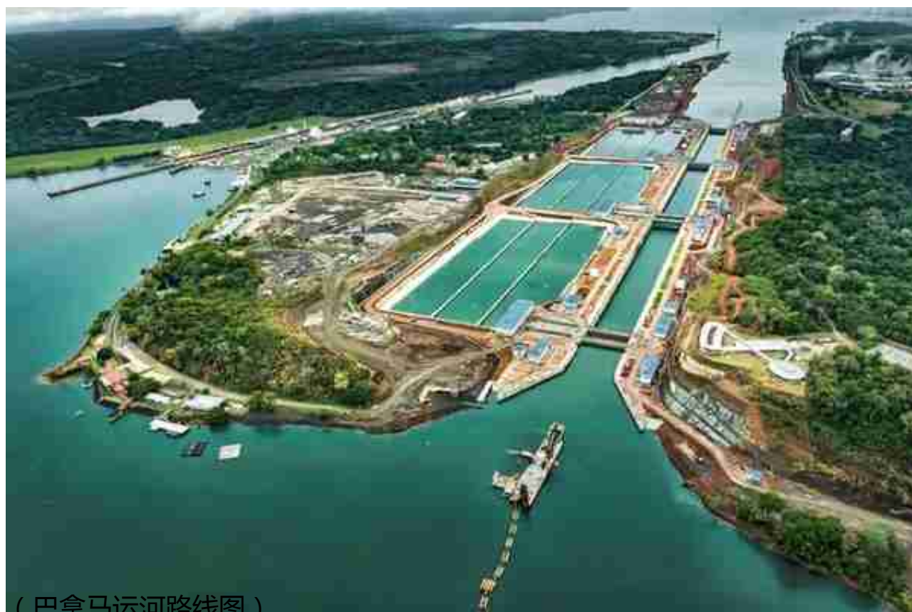
(巴拿马运河路线图)

急等钱用的西班牙国王，眼巴巴的等候着来自遥远南美的白银。然而安第斯山脉中间的波托西，当年既没有飞机场，也没有高铁。要把白银运到西班牙，需要用今天被视作萌宠的羊驼，背着六十磅的银锭，先通过印加古道运至利马。然后通过海路运到巴拿马城。上岸后，再用骡子等背驼，穿过巴拿马地峡到东海岸装船，最终由西班牙舰队护送，经加勒比海和大西洋送回西班牙。