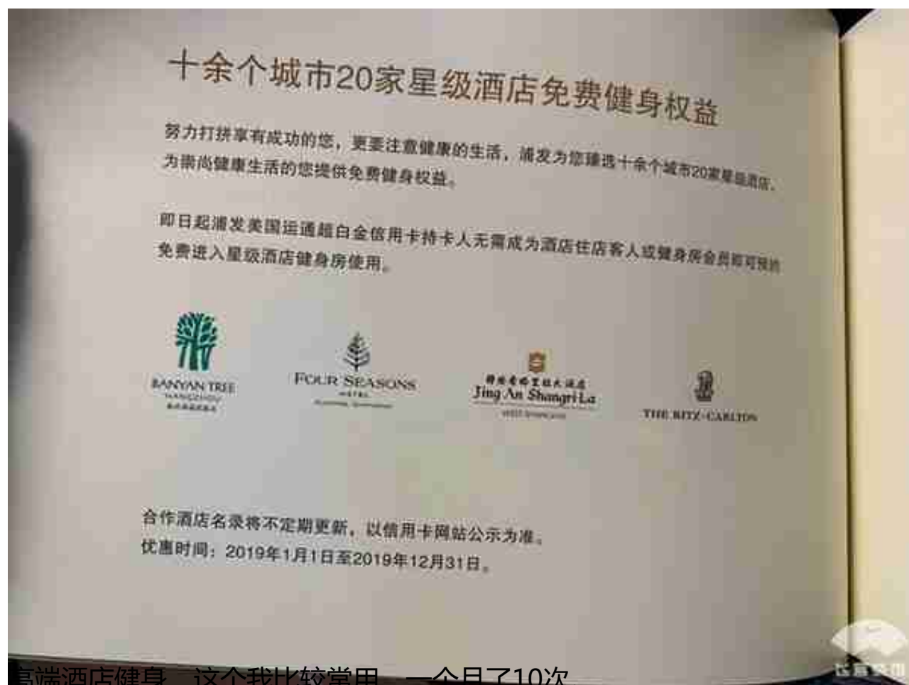
高端酒店健身，这个我比较常用，一个月了10次。