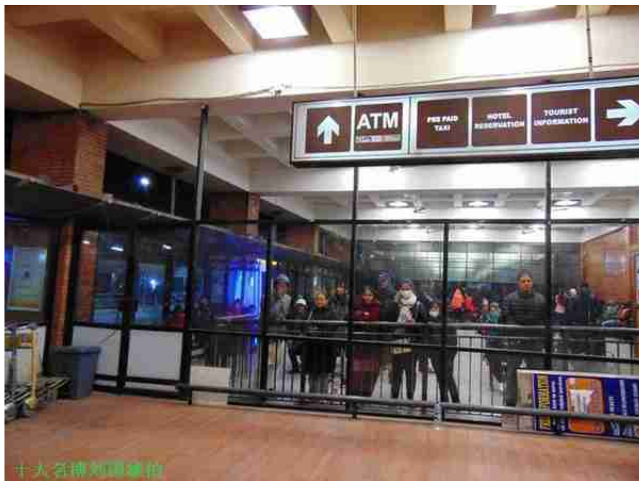
玻璃那边是候机厅