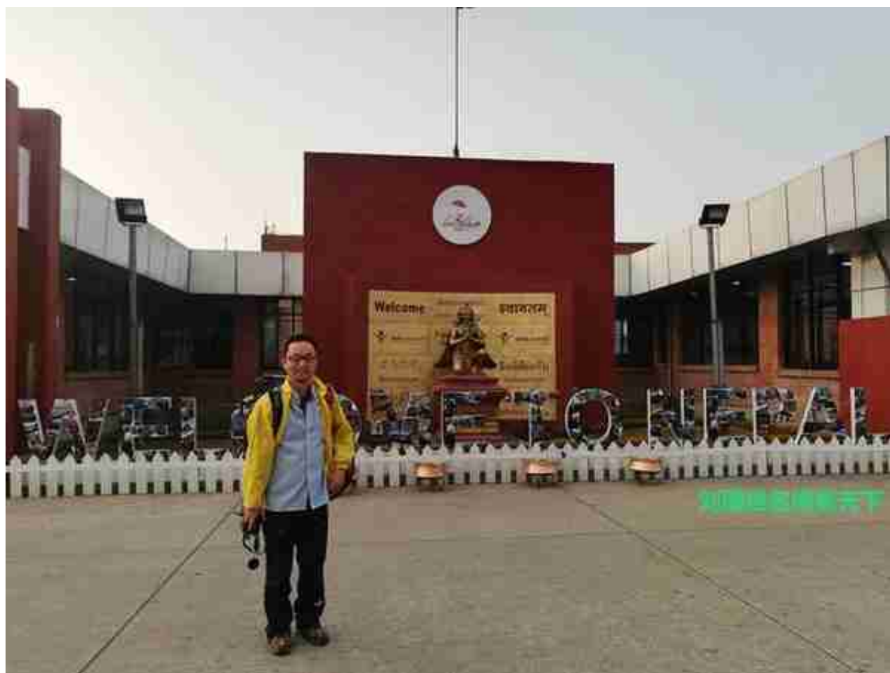
进航站楼前，有个适合拍照的地方