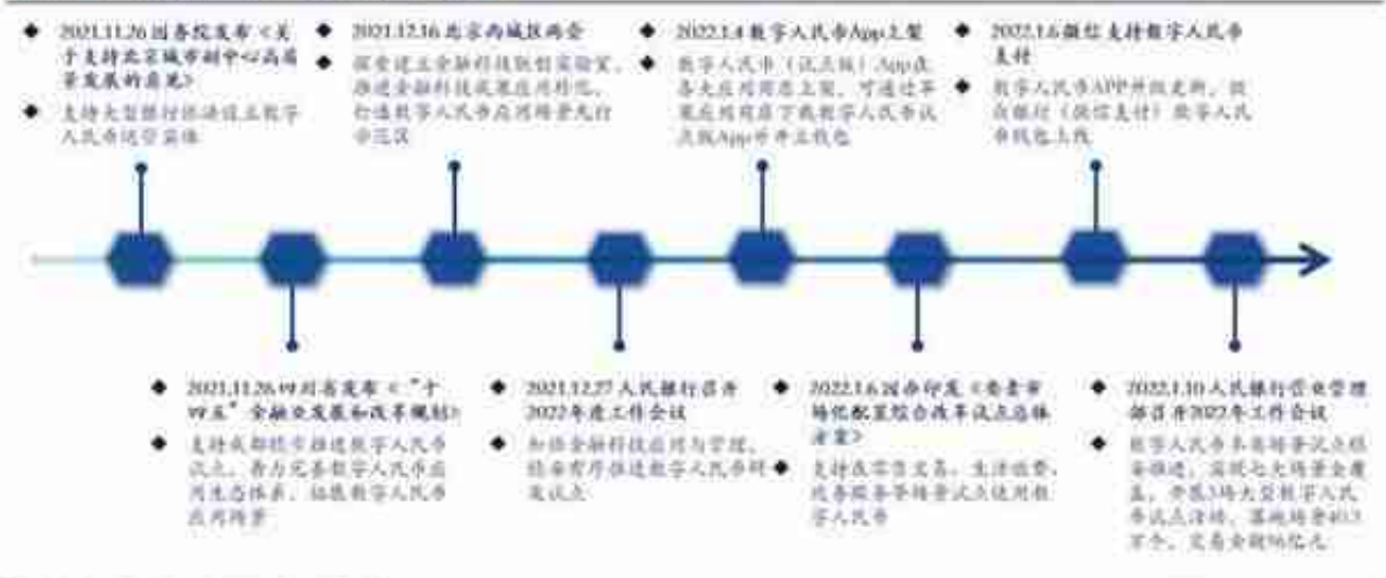
图 1: 数字人民币近期重要政策和事件梳理

，受人民币国际地位提升、国内经常项目大规模顺差、人民币资产的吸引力较强等因素影响，此次地缘冲突中人民币的避险属性初显，人民币汇率整体偏强运行。