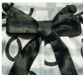
7. 一个漂亮的蝴蝶结就大功告成。蝴蝶结打烂穿。