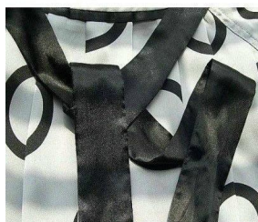
3. 将下面的带子折成蝴蝶结的一边，顺着带子的方向放置在右边。