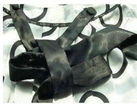
5. 上面的带子绕过右边的蝴蝶结后，折成另一边蝴蝶结