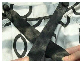
1. 先将两条带子交叉