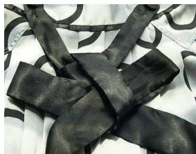
6. 将成形后的蝴蝶结慢慢整理。