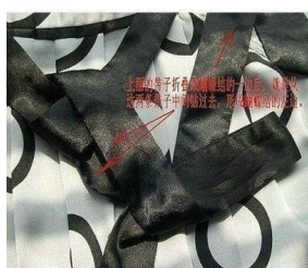
4. 再用上面的带子从蝴蝶结的上方向下方绕。