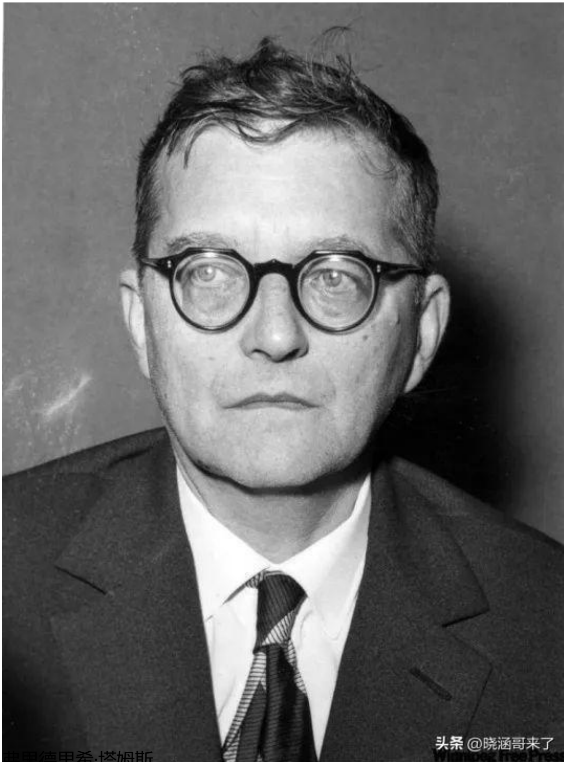
弗里德里希·塔姆斯