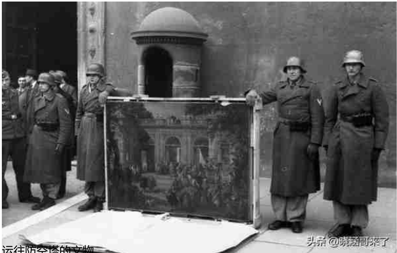
运往防空塔的文物