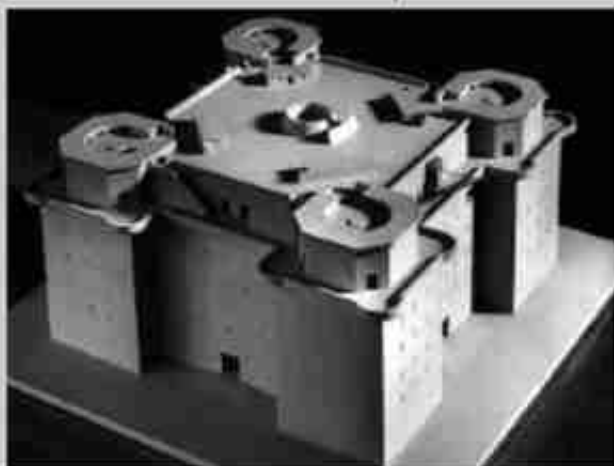
G-Turm I Berlin-Tiergarten : L-Turm I Berlin-Tiergarten Bauzeit: Oktober 1940 - April 1941