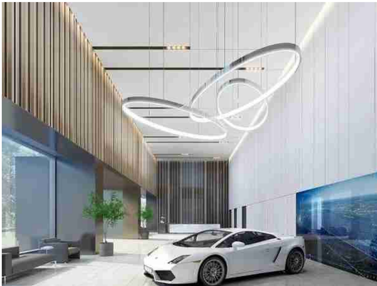
上海浦东汽车展示中心