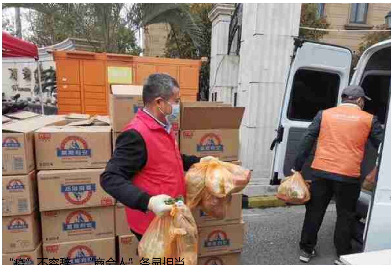
“疫”不容辞，“商会人”各显担当

“一线防疫人员不容易，他们的饭交给我，管够！”为了让朱泾镇防疫点位上忙碌的医务人员和志愿者们吃上一口热饭，从3月18日起，朱泾镇青创联副会长单位上海广缘大酒店在做好备餐、送餐各环节安全卫生严格把控的前提下，调配10台车辆和5名大厨，同时召集50多名党员群众组成配送团队，为战斗在村居疫情防控一线的人员提供暖心客饭，截至4月15日已累计配送7万余份。同时，酒店还保障着朱泾集中隔离点的用餐需求以及为社区爱心助老送餐提供志愿服务，从未间断。