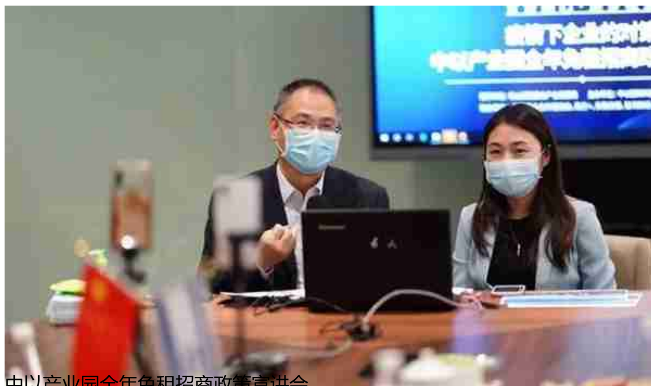
中以产业园全年免租招商政策宣讲会

选址960测试发现，通过各园区的微信公众平台、小程序或者二维码，如实填写企业名称、联系人、联系电话、拟申请租赁面积、拟入驻人数、申请租赁年限等基本信息，即可快速完成「入驻申报」。