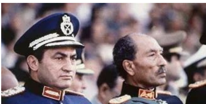
埃及浪漫主义总统纳赛尔与超现实主义总统萨达特