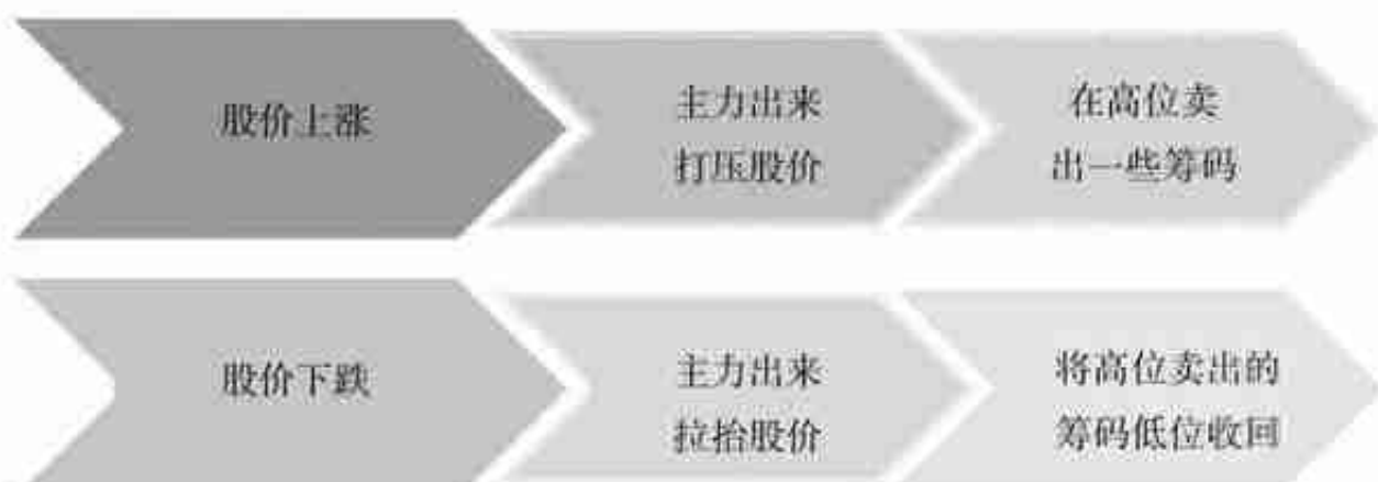
图4-2 主力洗盘中通过“高抛低吸”降低自身成本

主力洗盘的目的之一就是运用种种手段，将先期持股者赶下马去，防止其获利太多，中途抛货砸盘，最终威胁主力的拉升和派发。洗盘可以使主力出货有更宽敞的通道。通常盘中的浮筹分为两种：一种是不稳定筹码；另一种就是获利筹码，如图4-1所示。