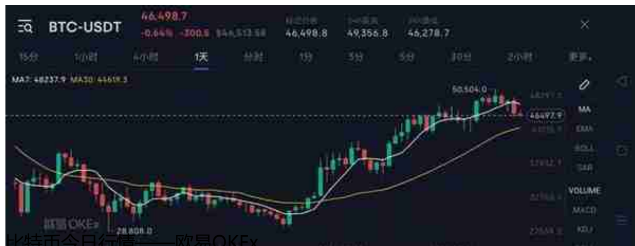
比特币今日行情——欧易OKEx