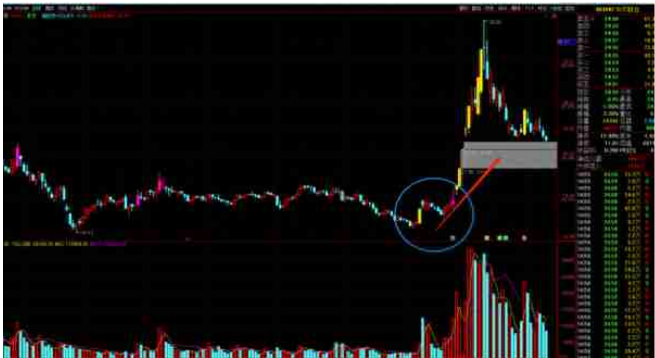
黑猫股份：涨停板密集+个股独立波段