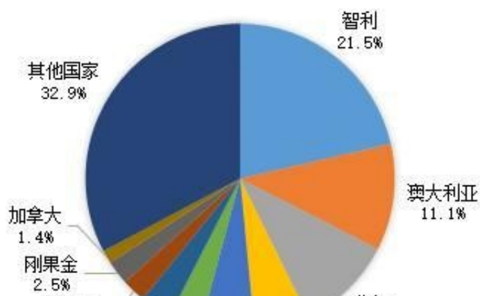
2017年全球主要国家铜储量占世界比例

2017年全球铜矿储量为7.9亿吨，其中智利铜矿储量最多，为1.7亿吨，遥遥领先于其他国家；其次为澳大利亚和秘鲁，储量分别为8800万吨、8100万吨。