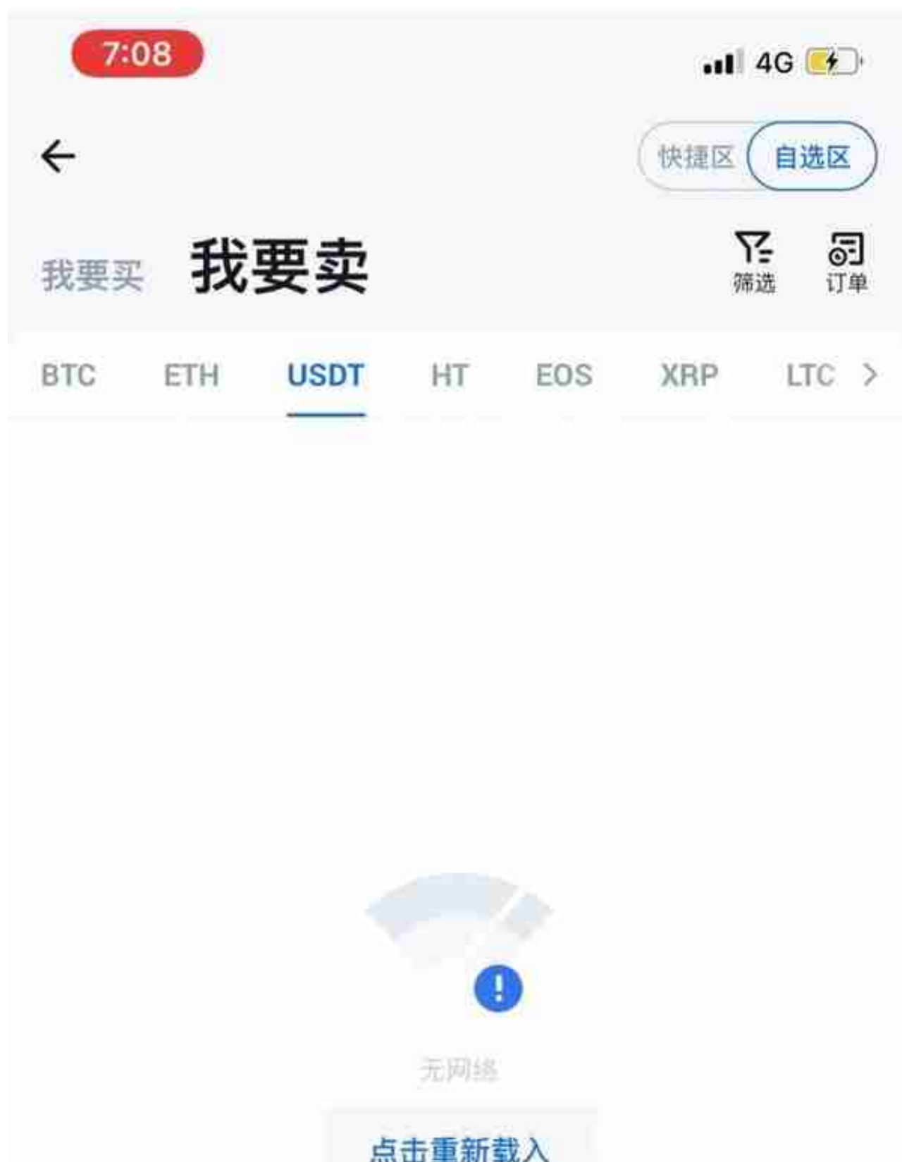
用户火币界面截图