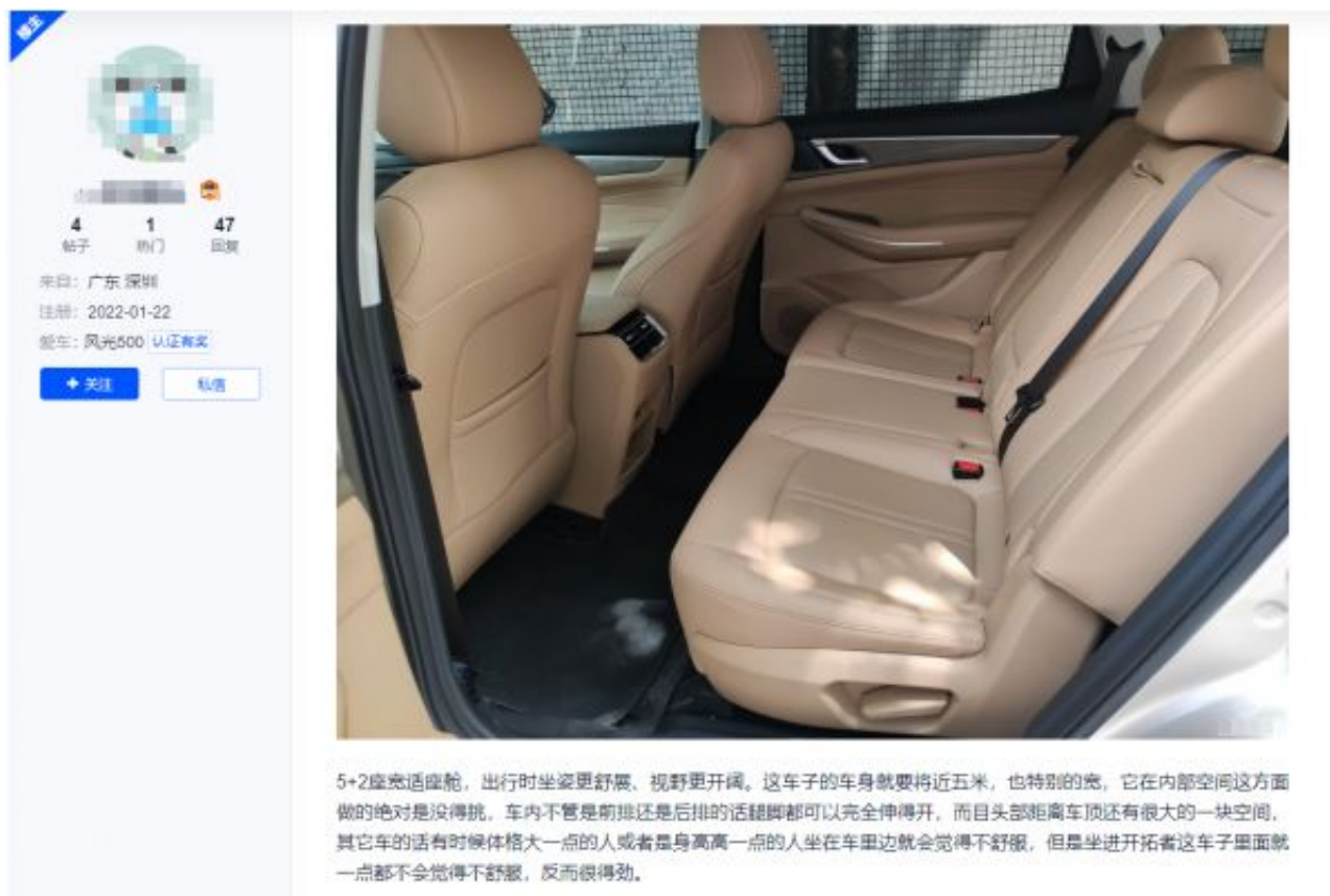
5+2座舒适座舱，出行时坐姿更舒展，视野更开阔。这车子的车身就要将近五米，也特别的宽，它在内部空间这方面做的绝对是没得挑。车内不管是前排还是后排的话腿脚都可以完全伸得开，而且头部距离车顶还有很大的一块空间，其它车的话有时候体格大一点的人或者是身高高一点的人坐在车里边就会觉得不舒服，但是坐进开拓者这车子里面就一点都不会觉得不舒服，反而很得劲。

这位车主就说了“蓝电E5在内部空间方面做的绝对是没得挑，车内不管是前排还是后排的话腿脚都可以完全伸得开，而且头部距离车顶还有很大一块空间。”