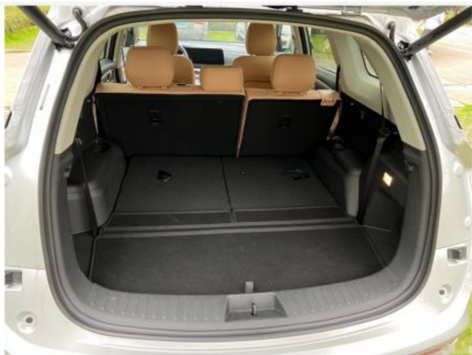
△后备箱的储物空间也是蛮大的，第三排平常不实用的话可以进行放平。

补充一点，大家也是比较关心新能源车辆的续航问题，当时我们也是考虑到，才选这款蓝电E5插电式混动汽车，可油可电，在日常上下班出行可以纯电出行，在HEV模式百公里综合油耗1.35L，馈电下百公里油耗5.5L，非常省油，一年下来省下的油费都可以用来买保险了，可上绿牌，出门也不限行，蓝电E5真的值得考虑。