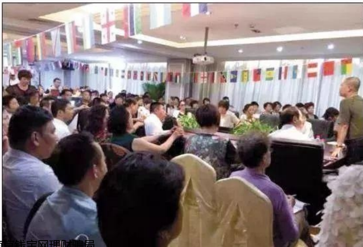
南京钱宝网理财骗局